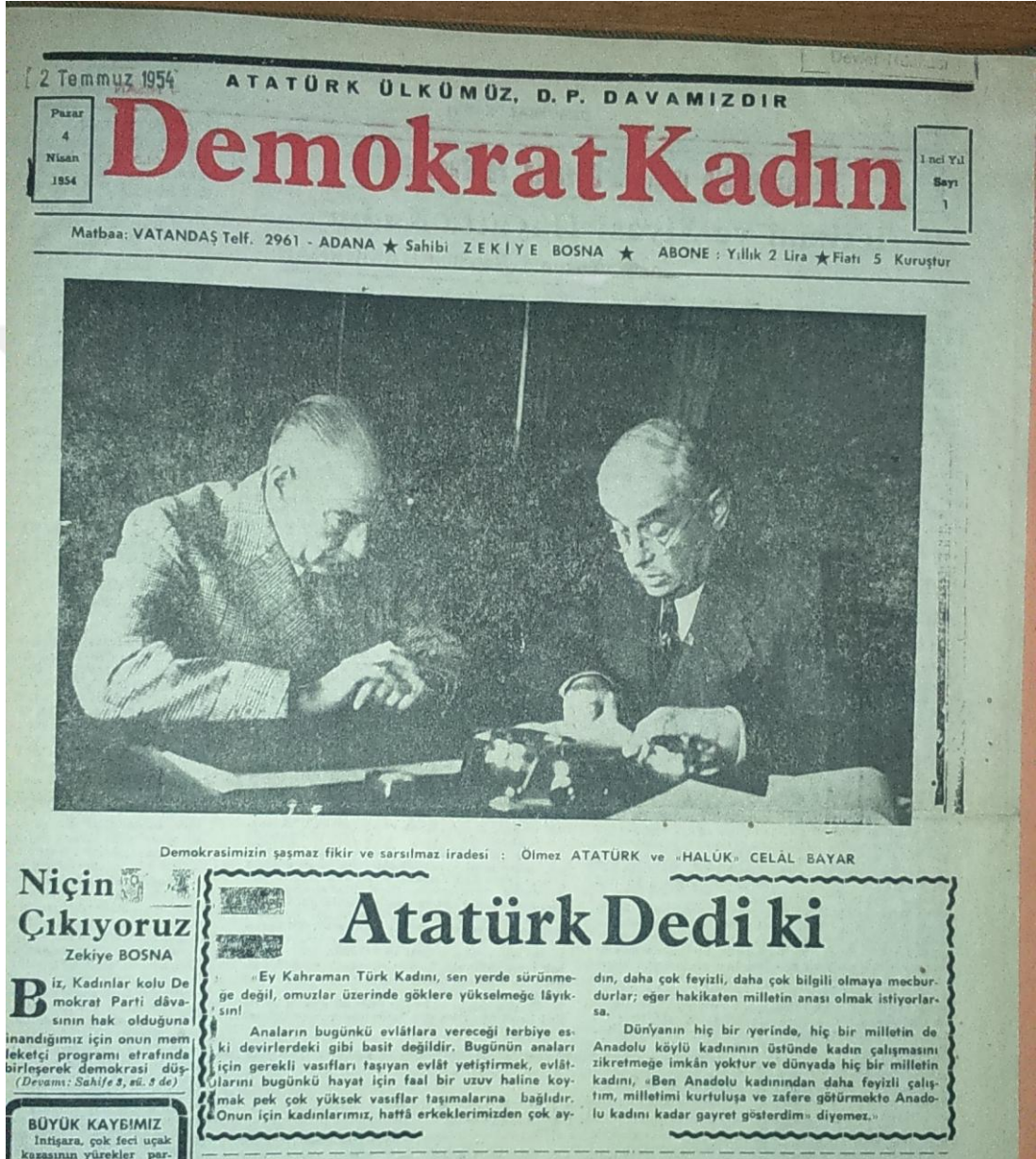
Demokrat Kadın (1954)