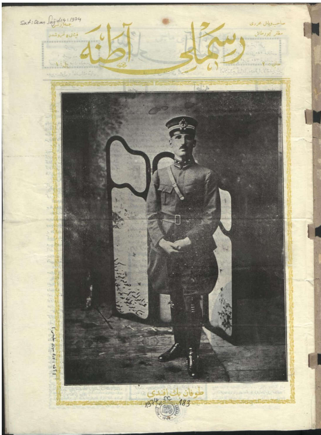
Resimli Adana (1926)