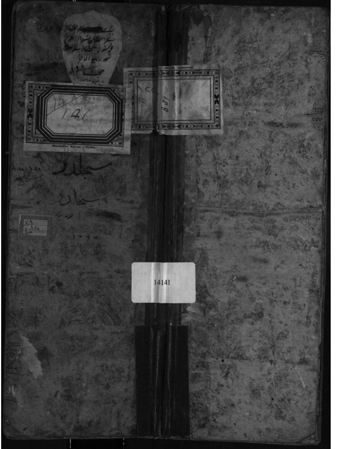
EK. 1. Galata Mahkemesine ait 141 Nolu Şer'îye Sicili'nin kapağı