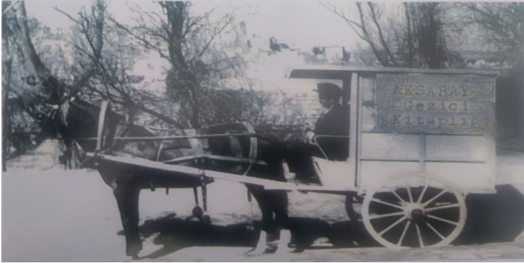
Görsel 2. Aksaray Halkevi Gezici Kütüphanesi a

Dil, Tarih ve Edebiyat Şubesi halkın eğitime yönelik olarak en çok çalışmış şubelerden biridir. Bu şube, il genelinde sürekli okuma-yazma etkinlikleri gerçekleştirmiş aynı zamanda Türk Dili Tetkik Cemiyeti talimatları doğrultusunda il genelinde dil konferansları düzenlemiştir. Dil, Tarih ve Edebiyat Şubesi'nin eğitim etkinliklerinde en büyük destekçisi ise Kütüphane ve Neşriyat Şubesi olmuştur. Kütüphane ve Neşriyat Şubesi'nin kütüphanesinde 3622 cilt kitap yer almıştır. Bu kitaplar, halkın okuma alışkanlığını ve fikri hayatını geliştirmesinde teşvik edici olmuştur. Kütüphane ve Neşriyat Şubesi'nin kitap faaliyetleri ile 1933 senesi içerisinde toplam 7550 yurttaş kitap okumuştur. Ayrıca, Aksaray Vilayet Gazetesi de neşriyat dâhilinde yer almıştır (Halkevlerinin 1933 Senesi Faaliyet Raporları Hulasaları, 1934).