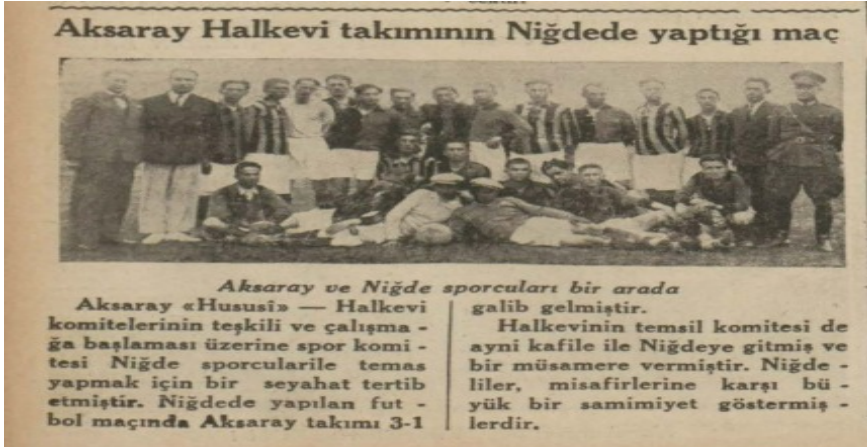
Görsel 3. Aksaray Halkevi Niğde Maçı, Cumhuriyet, 10 Mayıs 1935

Aksaray Halkevi, talimatnamede belirtildiği şekilde Spor Şubesi aracılığıyla özellikle gençleri sporla tanıştırmış ve pek çok farklı spor dalında etkinlikler düzenlemiştir. 1933 yılı faaliyet raporuna göre Spor Şubesi faaliyetleri kapsamında Futbol ve Voleybol sahaları yaptırıldığı ve gençlerin bu sahalarda çalışmalarının teşvik edildiği belirtilmektedir (Halkevlerinin 1933 Senesi Faaliyet Raporları Hulasaları, 1934). Spor şubesinin faaliyetlerinden birisi de düzenlenen spor müsabakalarıdır. 9 Mayıs 1935'te Aksaray Halkevi futbol takımı ile Niğde Halkevi sporcuları arasında özel bir maç yapılmıştır. Niğde Halkevi yetkilileri, Aksaray Halkevi Spor Komitesi çalışanlarını sıcak ve samimi bir ortamda karşılamıştır. Yapılan etkinliklerde her iki takımın sporcuları dostluk havasında müsabakalarını gerçekleştirmiştir. Etkinlikler sonunda basına açıklama yapan Aksaraylı Halkevi konukları, Niğde'de çok iyi ağırlandıklarını açıklamışlardır. İki halkevi takımının karşı karşıya geldiği futbol maçını 3-1 skorla Aksaray Halkevi Futbol Takımı kazanmıştır (Cumhuriyet, 10 Mayıs 1935).