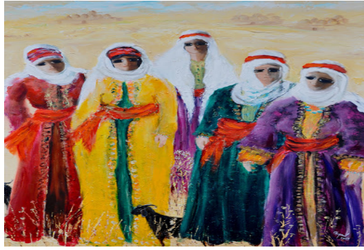
Görsel 4. Fikret Otyam Eserlerine Birkaç Örnek