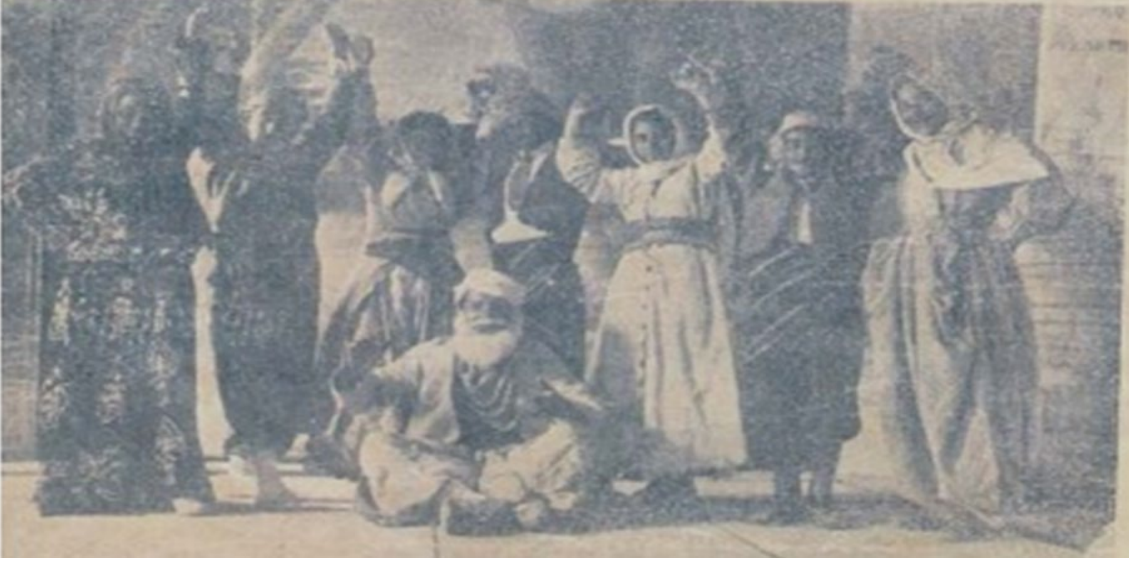
Ek-1. Aksaray Halkevi Folklor Ekibi, Bandosu ve Müzik Öğrencileri