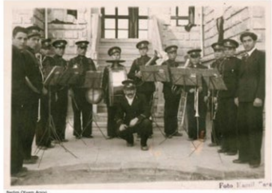
Görsel 1. Aksaray Halkevi Müzik Komitesi Çalışmaları ve Öğrencileri

Müzik ve eğitimin birlikteliği ve sosyal hayatı geliştirmede müziğin oynadığı rol, Aksaray Halkevi'ni bu yönde aktif faaliyetler gerçekleştirmeye itmiştir. Aksaray Halkevi Müzik Komitesi ile halka çeşitli müzik aletlerinin kullanılmasının öğretilmesi ve koro çalışmaları alanında eğitimler vermiştir. Bu eğitimler ile birlikte aynı zamanda müzik grupları oluşturularak çeşitli vesilelerle gösteriler düzenlenmiştir (Baydar, 2010).