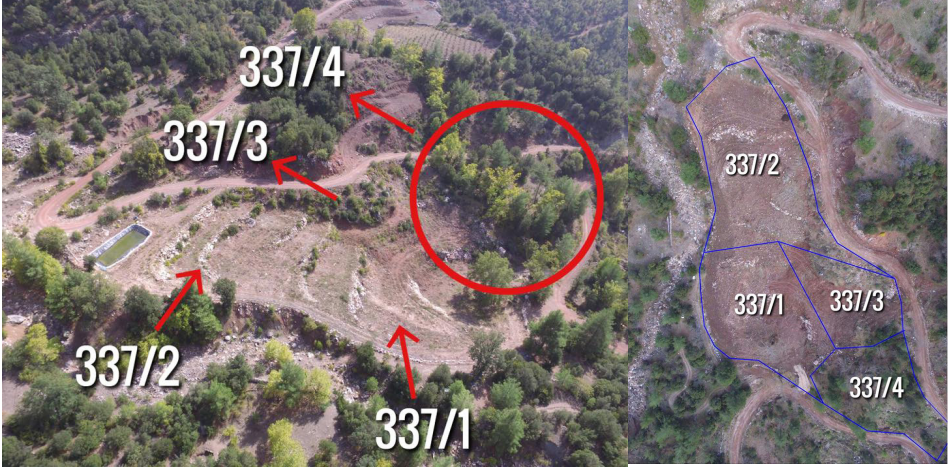
Resim 4. İhale Parselleri

itirazı reddedilerek ihale onayı aktivistlere tebliğ edildi. Ardından arazilerin bedeli peşin olarak Kumluca Mal Müdürlüğüne ödendi ve tapu devir işlemleri başlatıldı. 22 Mayıs'ta da tapular alındı (Yılmaz, 2019).