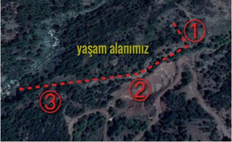
Resim 2. Çevresel İhtilafın Odağı

degöl Enerji şirketine ait Kürce HES'in şantiye şefinin yaşam alanımızın etrafındaki arazileri satın almaya çalışmasını öğrenmemizle başladı. Bunu gelip bize söyleyen köylüler arazilerini satmadıkları için pek önemsemedik başta bize karşı şirketin oynadığı oyunların içindeki bu 'yeni' gelişmeyi. Ta ki, hemen yaşam alanımızın girişinde bulunan, zamanında birinin ek-tiği asmaları tüm canlılara vakfetmesiyle adı "Vakıflar" diye anılan, her gelen geçenin ve birçok canlının durup, ulu meşe ağaçlarına sarınmış asır-lık bereketli üzümlerinden şifalandığı bu meşe ormanının, tapu geldiğinde [özel bir şahsın] üzerine yazıldığını, onun da burayı şantiye şefine sattı-ğını öğrenene kadar. Çok geçmeden bu alana Kumluca Orman İşletmesi memurları geldi. Ne yaptıklarını sorduğumuzda "arazi sahibinin 'tapulu kesim' için başvurduğunu, ağaçları işaretlemeye geldiklerini" söylediler. Hiçbir yorumda bulunmamamıza rağmen içlerinden bir memur "Hem size ne? Adam satın almış. İster keser ister yakar!" diye çıkışınca bir şeyler döndüğünü hissettik iyice. Memurlar gittiğinde arazideki tüm ağaçların ke-silmek üzere işaretlendiğini gördük. Bunların arasında çok büyük ve ulu meşe ağaçları da vardı. ("Vakıflar Katliamı", 2016).