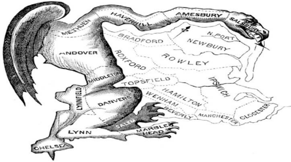
Şekil 1 4 : Gerrymandering Tasvirli Karikatür

Demokratik Cumhuriyetçilerin sandalye sayısını artırmaktır (Caughey vd., 2017:1). Terim Vali Gerry'nin desteği ile oluşturulan seçim çevresinin harita üzerinde semender hayvanına benzemesinden dolayı Vali Gerry'nin soyadı ile İngilizce salamander olarak nitelenen semender hayvanının isminin birleşmesinden oluşmaktadır (Cover, 2018:8). Gerrymandering terimi ilk kez 26 Mart 1812 tarihinde Boston Gazette'de Elkanah Tisdale'nin çizmiş olduğu karikatürle kullanılmıştır (Tunç vd., 2014:97-99). Karikatür Şekil 1'de verilmiştir.