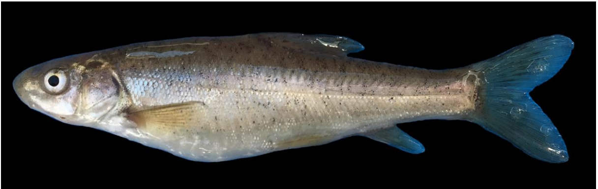
Şekil 4. Capoeta pestai (78,5 mm SB, Melendiz Çayı). Figure 4. Capoeta pestai (78.5 mm SB, Melendiz Stream).