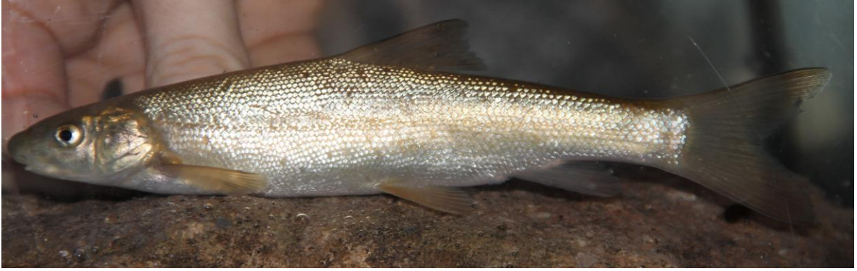
Şekil 2. Capoeta baliki (118,1 mm SB Dünderlı Çayı). Figure 2. Capoeta baliki (118.1 mm SB Dünderlı Stream).