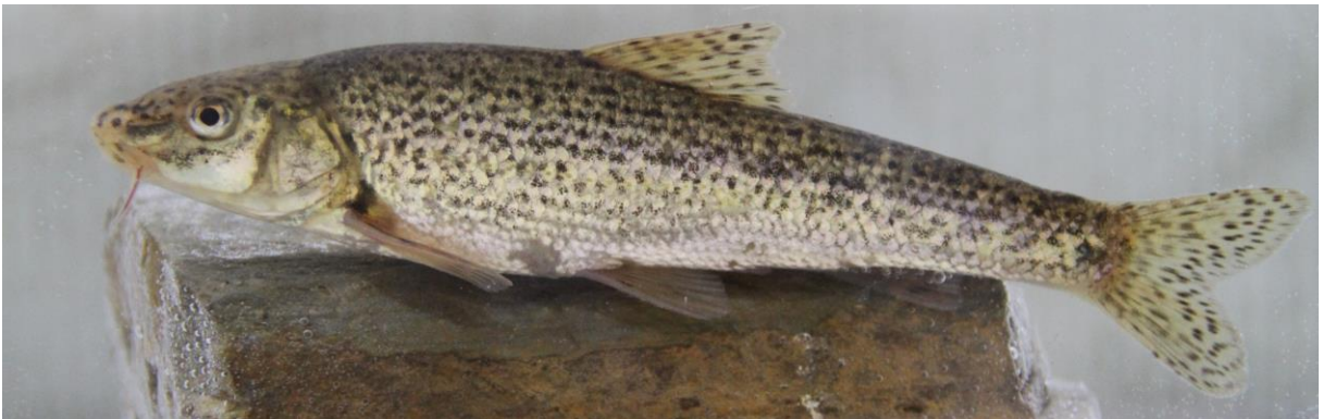
Şekil 7. Gobio gymnostethus (112,7 mm SB, Melendiz Çayı). Figure 7. Gobio gymnostethus (112.7 mm SB, Melendiz Stream).