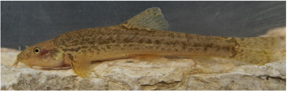
Şekil 9. Oxynoemacheilus eregliensis (82,6 mm SB, Melendiz Çayı).