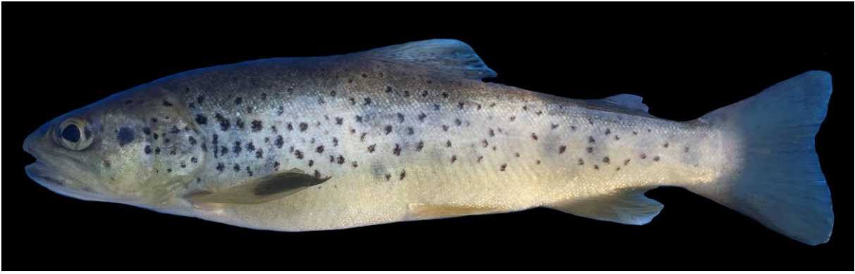
Şekil 12. Salmo labecula (147 mm SB, Ecemiş Çayı). Figure 12. Salmo labecula (147 mm SB, Ecemiş Stream).