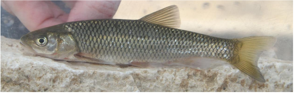
Şekil 6. Squalius cappadocicus (113,8 mm SB, Melendiz Çayı). Figure 6. Squalius cappadocicus (113.8 mm SB, Melendiz Stream).