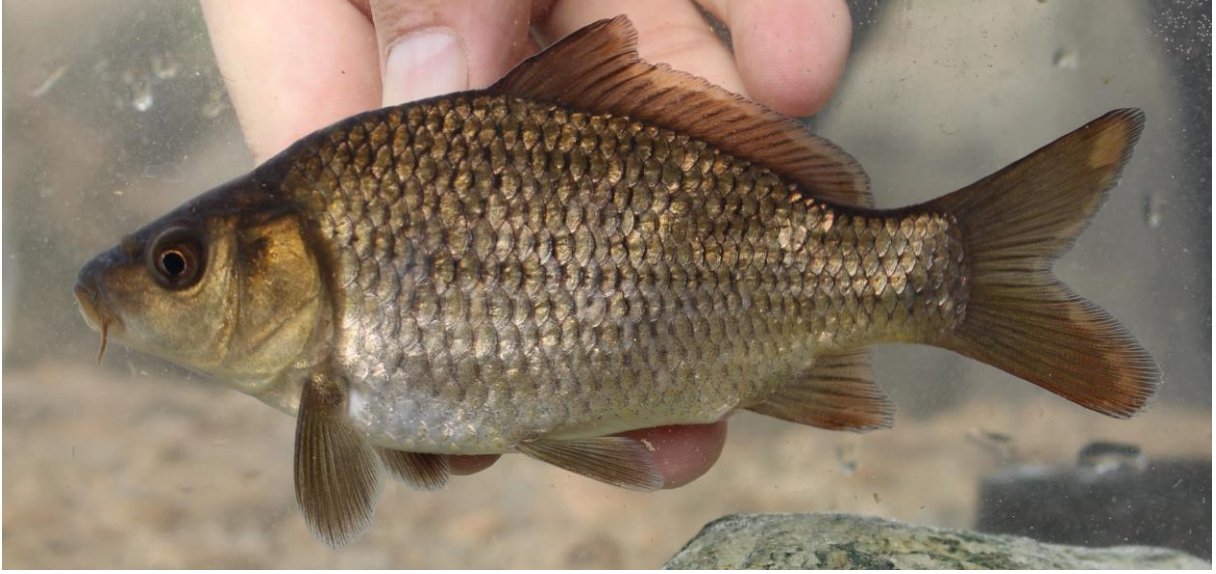
Şekil 5. Cyprinus carpio (135,5 mm SB, Gümüşler Barajı). Figure 5. Cyprinus carpio (135.5 mm SB, Gümüşler Dam).