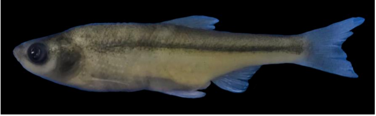
Şekil 8. Pseudophoxinus battalgilae (60,6 mm SB, Hüsniye Göleti).