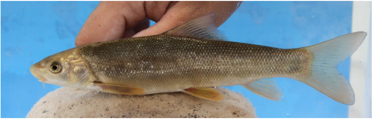
Şekil 3. Capoeta damascina (149,5 mm SB, Çiftehane Çayı). Figure 3. Capoeta damascina (149.5 mm SB, Çiftehane Stream).