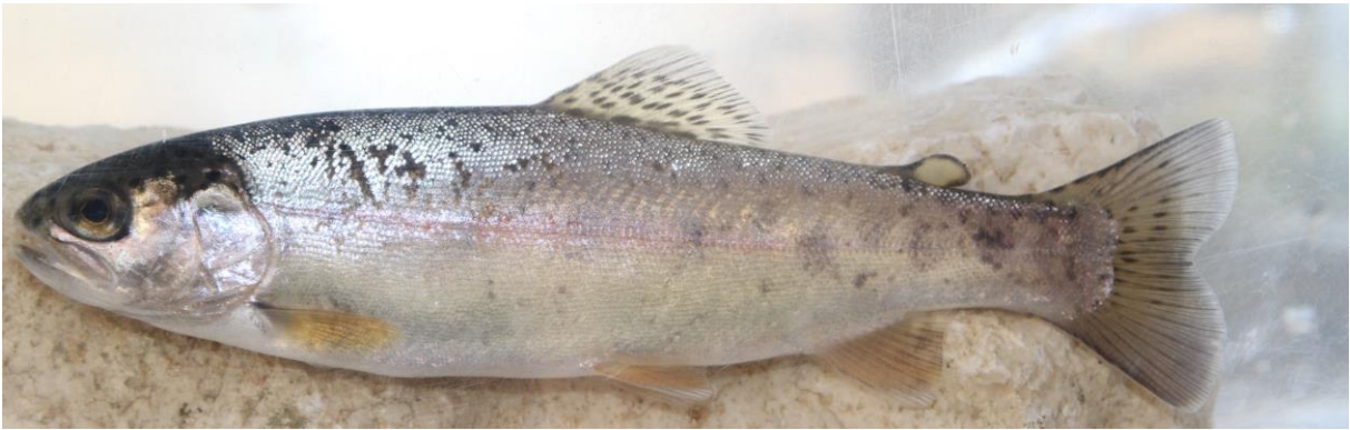
Şekil 13. Oncorhynchus mykiss (115 mm SB, Ecemiş Çayı). Figure 13. Oncorhynchus mykiss (115 mm SB, Ecemiş Stream).

Konya Kapalı Havzasında bulunan istasyonlarda Capoeta pestai , C. carpio , Gobio gymnotethus , Oxynoemacheilus eregliensis ve Squalius cappadocicus ; Seyhan Havzasındaki istasyonlarda Capoeta damascina , C. carpio , Pseudophoxinus battalgilae , Salmo labecula , Oxynoemacheilus cilicicus ve Oncorhynchus mykiss ; Kızılırmak havzasındaki istasyonlarda ise C. carpio , O. mykiss , Capoeta baliki ve Oxynoemacheilus ciceki türleri