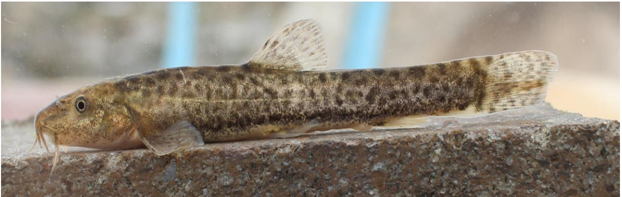
Şekil 10. Oxynoemacheilus ciceki (92,1 mm SB, Dünderlı Çayı).