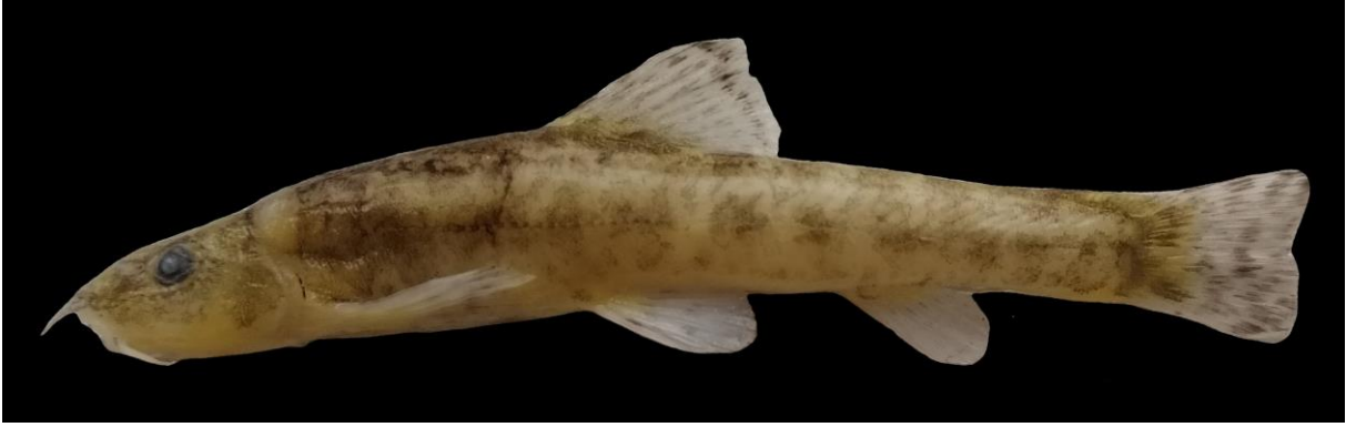
Şekil 11. Oxynoemacheilus cilicicus (74,6 mm SB, Hüsniye Göleti). Figure 11. Oxynoemacheilus cilicicus (74,6 mm SB, Hüsniye Pond).