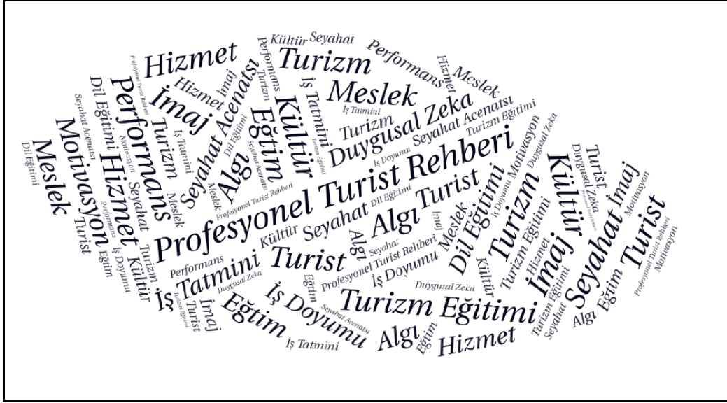
Şekil 1. Lisansüstü Tezlerin Kullandığı Anahtar Kelime Bulutu