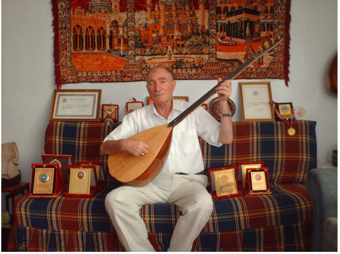
Fotoğraf 4: Âşık Bayramî sazı ve almış olduğu ödülleri ile birlikte.