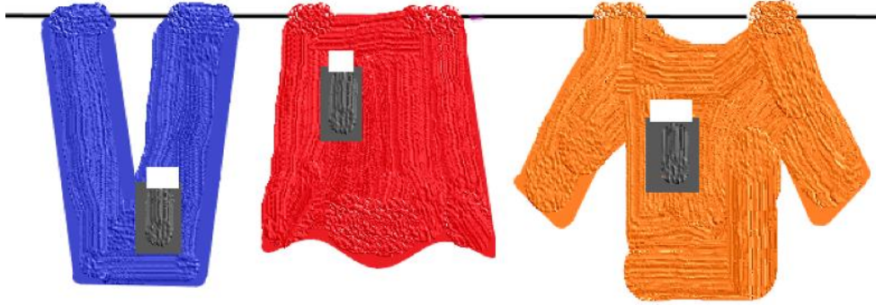
Şekil 2. Yaş mı? Kuru mu? Etkinlik görseli