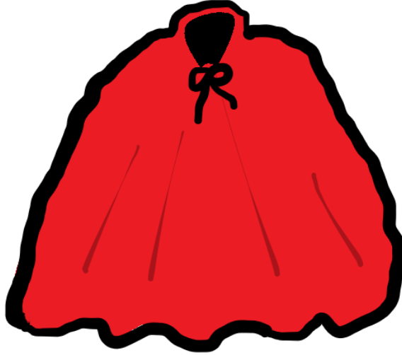
Şekil 3. Pandomim etkinlik görseli