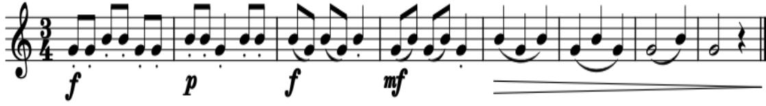
Şekil 3. Çalışma Önerisi 3

Boş “Sol” sesini çaldığımızda sağ elimizi kapatmamız on ikilik perdeye daha rahat geçmemizi sağlayacaktır.