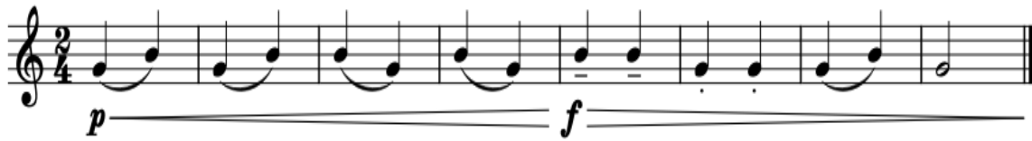
Şekil 2. Çalışma Önerisi 2

Çalışma 1’de metronom hızının yavaş başlatılması ilk öneride oldukça önemlidir. Parmakların geçişte uyum sağlaması için ilk önce nüansız düz bir şekilde çalışılmalıdır. İlk iki ölçüde nefes alıp sonrasında ilk üç ölçüyü tek nefeste çalmayı hedeflemeliyiz. Metronom hızı nefesimize yetecek kadar yol alınırsa öneriyi tek nefeste çalmamız yarar sağlayacaktır. Boş “Sol” sesi tutarken sağ elimizin alt gövdede yer alan kalın ”Sol” notasına basmamız bazı klarnetlerde doğru entonasyon sağlaması açısından oldukça önemlidir. Özellikle klarnetin boş “Sol” sesi duyum açısından tiz ya da pes kaldığı için akort cihazıyla kontrol edilerek üflenmelidir. Önerileri çalışırken, seslerin doğru ses entonasyonda olup olunmadığına dikkat edilerek çalışılmalıdır. Önerideki yazılan nüansları ekleyerek müzikal kaliteyi de gözden kaçırmamak gerekir.