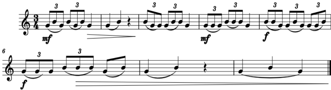
Şekil 5. Çalışma Önerisi 5

Çalışma 4’de onaltılık tekrarlanan notaların sık bir şekilde çalınması sağlanacaktır. Parmak ve dil hareketinin aynı anda olması çalışmanın amacıdır. Bağlı ve dilli artikülasyonlara dikkat edilmelidir. Bir yandan nüans farkları ortaya çıkarılırken bir yandan da seslerin tane tane gelmesine özen göstermeliyiz. Crescendo (sesin giderek yükselmesi) Decrescendo (sesin giderek alçalması) için piyano nüansının belli bir ayarda başlaması tonumuzu ve ses yükselişini kontrol etmek açısından önemlidir.