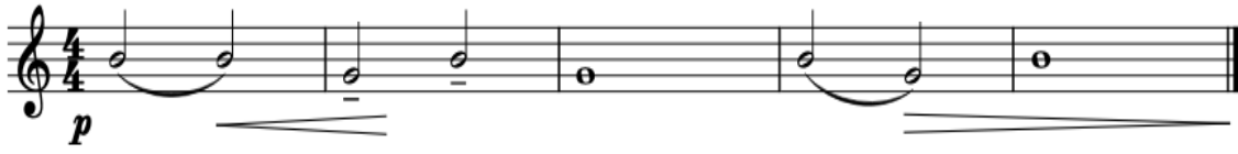
Şekil 1. Çalışma Önerisi 1

sağlayacaktır. İnsanın kişiliğinin gelişmesi nasıl kişisel özgürlüğünü oluşturuyorsa klarnette de parmakların daha kontrollü hareket etmesi gereklidir. Parmak tekniğinin doğru öğrenilmesi ve devamlılığı hızlı çalmanın bir göstergesi olacaktır” (Çelik, 2018: 73). Çalışmada altı çalışma önerisi ve iki eser çalışmasına yer verilmiştir. Çalışmalar özgün çalışmalardan oluşmaktadır. Pasaj geçişleri, başlangıç seviyesinden başlayarak her aşama bir sonraki öneriye hazırlanarak tasarlanmıştır. Belirli nota seçimi “Sol” notasından “Si” notasına geçerken legato (bağlı) çalış zorluğu ve sesin doğru çıkmasını engelleyen teknik ve ağız kontrolünün sağlanmasında izlenecek yol haritası amaçlanmıştır. Çalışma önerilerinin disiplinli ve titiz çalışma ile pozisyon geçiş kolaylığı sağlanması hedeflenmiştir.