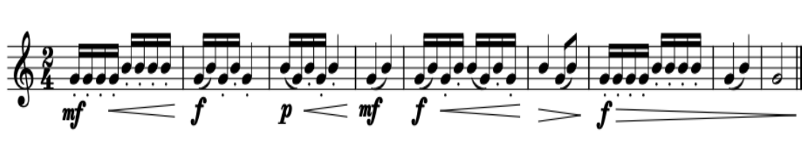
Şekil 4. Çalışma Önerisi 4

Çalışma 3’de artikülasyon çeşitliği de sağlanacaktır. Staccato (dilli) Legato (bağlı) arasındaki fark pasaj geçişleri sayesinde hızlanacaktır. Bir yandan pasaj geçişini çalıştırırken bir yandan da nüans farklarını (forte -piyano-mezzo forte) çalıştırmayı hedefleyecektir. Staccattolar oldukça kısa yapılmalı tekrarlanan seslerin temiz çıkmasına dikkat edilmelidir.