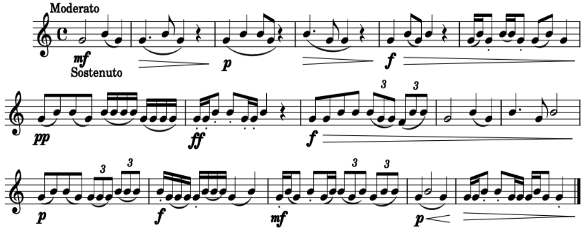
Şekil 7. Eser Çalışması 2

çıkacaktır. Eserin notasyonunu mükemmel çalmak kadar yazılan esere duygu ve yorum gücünü katmak ayrı bir yorumculuk sanatıdır.