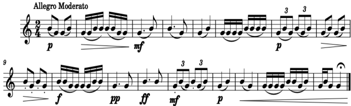
Şekil 6. Eser Çalışması 1

Çalışma 6’da farklı ritim kalıbı ile zenginleştirilerek, pasaj çalışması daha verimli ve zevkle hale dönüştürülmesi hedeflendirilmiştir. Bir eserde karşımıza çıkacak pasaj çalışmasının zamanında yapılmasının karşılığının alındığı ilerleyen zamanlarda gözlemlenecektir. Özellikle staccato atarken diyaframı iyi kullanmak seslerin daha dolgun gelmesini sağlayacaktır. Nüans farklarına dikkat etmek ise nefesimizi tasarruflu kullanmamızı ve kendimizi çok yormadan uzun saatler çalışmayı sağlayacaktır.