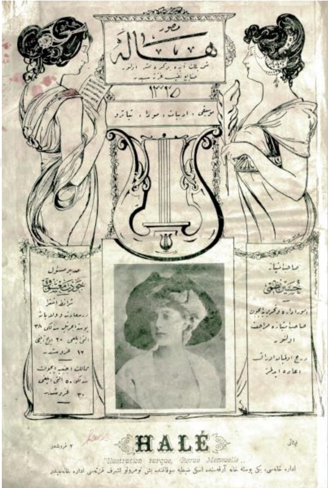
Ek 2. Musavver Hâle Dergisinin İkinci Sayısının Kapağı