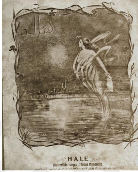
Şekil 1.2. Celile Hikmet imzalı tablo

“münderecat” (içindekiler) ve gelecek sayı ile ilgili bilgiler içeren bir sayfa, üçüncü sayıda da kapak sayfasından önce Celile Hikmet imzalı tablo bulunan bir sayfa bulunmaktadır. (bk. Resim 2). Derginin üç sayısında da arka kapakta reklam ve ilanlara yer verilmiş, üçüncü sayının son sayfasında diğerlerinden farklı olarak bir ve iki numaralı sayıların münderecatı eklenmiştir.