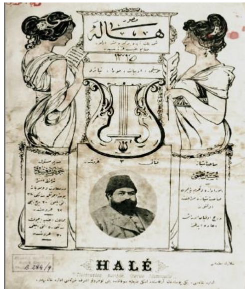
Şekil 1.1. Musavver Hâle dergisi kapak resmi