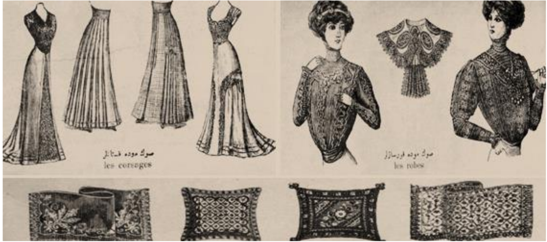
Şekil 1.4. Moda İle İlgili Görseller

Edebiyat ile ilgili yazılarda kullanılan görseller, ise kişilerin biyografilerinin anlatıldığı kısımlarda yazıya ek olarak portrelerinin verilmesi açısından önem arz etmektedir. Ayrıca dergi de muharrirlerinden ve sanatçılardan yer yer fotoğraflar da sunulmuştur. Bu tür görsellerin kullanımı sanatçıların “kısa rollerinin ve kostümlerinin eklendiği alanlarda” derginin içeriği ve çeşitliliği açısından dikkat çektiği aşikârdır.