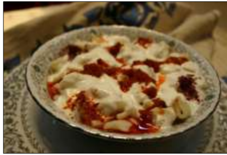
Resim 3. Kayseri Mantısı

22.05.2006 tarihinde Kayseri Ticaret Odası tarafından başvurusu yapılan ve C2006/011 başvuru numaralı coğrafi işaret ile tescillenen Kayseri Mantısı, 28.06.2008 tarihinde 26920 sayılı Resmî Gazete’de tescillenerek koruma altına alınmıştır (TPK, 2018). Coğrafi işaretli ürüne ait görsel Resim 4’de verilmektedir.