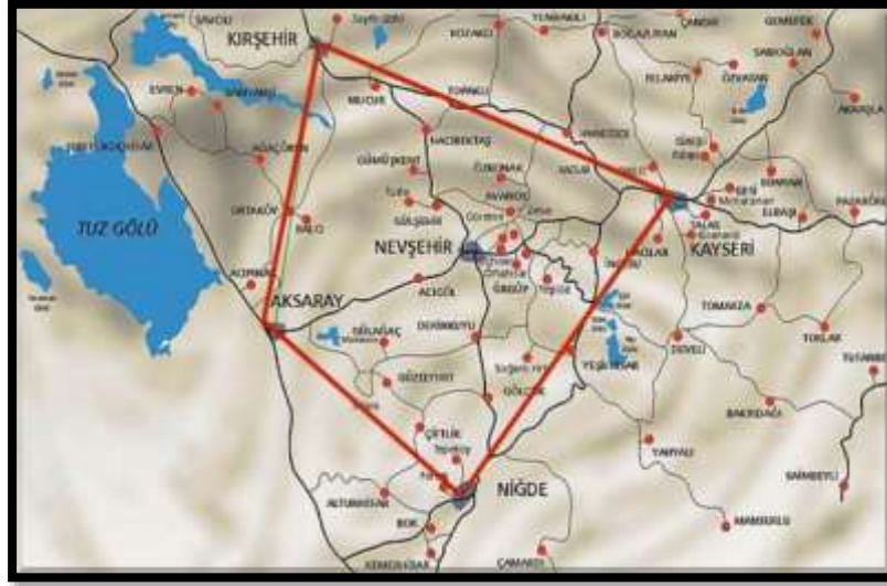
Harita 1. Kapadokya Bölgesi

Kapadokya Bölgesi yöresel ürünlerin fazla olduğu önemli bir bölgedir. Kapadokya Bölgesi'nde sadece Kayseri ve Nevşehir illerinde coğrafi işaret almış tescilli ürünler ve Aksaray'da başvuru aşamasında yöresel ürünler bulunmaktadır. Türk Patent ve Marka Kurumu resmî sitesinde 05.05.2018 tarihi itibarıyla Kapadokya Bölgesi'ne ait coğrafi işaret ile tescillenmiş 8 adet ürün ve başvuru aşamasında olan 2 adet ürün olduğu tespit edilmiştir. Bölgedeki coğrafi işaretli ürünler açısından değerlendirildiğinde, 2 adedi mahreç işareti ile 6 adedi menşe adı olarak tescillenmiştir. Coğrafi işaret ile tescillenmiş bu ürünlerden 8 adedi ve başvuru aşamasında olan coğrafi işaretlerden 2 adedi gastronomik ürün özelliğindedir (TPK, 2018). Genel olarak Kapadokya Bölgesi'nde yöreye özgü birçok ürün olmasına rağmen, coğrafi olarak tescilli ürünlerin sayısının az olduğu dikkat çekmektedir.