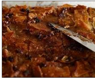
Resim 9. Aksaray İnceelek Tatlısı

C2017/215 başvuru numaralı Aksaray İnceelek Tatlısı başvuru aşamasındaki coğrafi işaretli ürünler arasında yer almaktadır. Henüz coğrafi işaret ile tescillenmemiştir (TPK, 2018). Coğrafi işaretli ürüne ait görsel Resim 10'da verilmektedir.