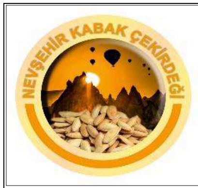
Resim 1. Nevşehir Kabak Çekirdeği Logosu

30.10.2017 tarihinde Nevşehir Ticaret Borsası tarafından başvurusu yapılan ve C2017/166 başvuru numaralı coğrafi işaret ile tescillenen Nevşehir Kabak Çekirdeğinin 02.04.2018 tarihinde Türk Patent ve Marka Kurumu'nun yayınlamış olduğu 2018/26 Sayılı Resmi Coğrafi işaret ve Geleneksel Ürün Adı Bülteni'nde tescillenerek koruma altına alındığı belirlenmiştir (TPK, 2018). Coğrafi işaretli ürüne ait logo Resim 1'de verilmektedir.