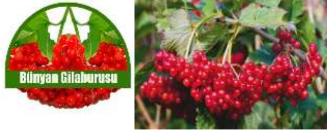
Resim 7. Bünyan Gilaburusu Logosu ve Görseli

16.02.2017 tarihinde Bünyan Belediye Başkanlığı tarafından başvurusu yapılan ve C2017/011 başvuru numaralı coğrafi işaret ile tescillenen Bünyan Gilaburusu, 01.06.2018 tarihinde 2018/30 sayılı Resmî Gazete'de tescillenerek koruma altına alınmıştır (TPK, 2018). Coğrafi işaretli ürüne ait logo ve görsel Resim 8'de verilmektedir.