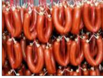
Resim 2. Kayseri Sucuğu

Kayseri Sucuğu; sığır etlerinin sarımsak ve baharatla karıştırılması ve bağırsakların içerisine doldurulması ile hazırlanmakta, özel kurutma ve renk aldırma işlemlerinden geçmektedir. Sucuk için kullanılan et ve yağ sucuk ustaları tarafından kuşbaşı kesilip kıyma makinalarında çekilip, daha sonra karışıma tuz, baharat, kimyon ve sarımsak ilave edilerek hazırlanmaktadır. Elde edilen karışım 1 gün teknede bekletilmektedir. Daha sonra sucuk hamuru özel makinalarla tabii ve suni bağırsaklara doldurulmakta ve doldurulan sucuklar tekrar kurutulularak hazır hale getirilmektedir (TPK, 2018).