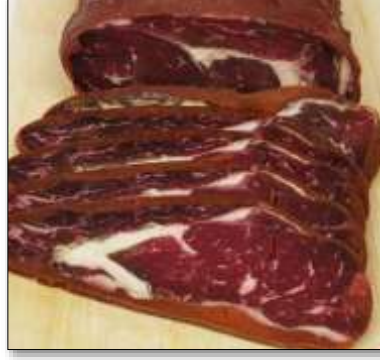
Resim 1. Kayseri Pastırması

13.09.2000 tarihinde Kayseri Ticaret Odası tarafından başvurusu yapılan ve C2000/08 başvuru numaralı coğrafi işaret ile tescillenen Kayseri Pastırması, 28.01.2018 tarihinde 24301 sayılı Resmî Gazete’de tescillenerek koruma altına alınmıştır (TPK, 2018). Coğrafi işaretli ürüne ait görsel Resim 2’de verilmektedir.