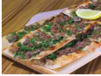
Resim 5. Develi Cıvıklısı

Develi Cıvıklısı etli ekmeğe benzer bir üründür. Hamurunda kullanılan su ve unun bölgeye has olması cıvıklıyı benzer ürünlerden ayıran en belirgin özelliktir. Yapımında Tip-2 un kullanımı yaygındır. Özelliğini 74-76 randımanlı buğday unu ve içerisinde kepek ve gluten miktarının yoğun olmasından almaktadır. Bir diğer belirgin özelliği ise Develi Cıvıklısının pişirildiği fırındır. Bu fırının özelliği ise, sıcaklık muhafazası sağlayan, hızlı ısınarak geç soğuyan, iyi bir ısı yalıtımı sağlayan od taş (Erciyes Dağına has) kaya tuzu, cam parçaları ve bimis (ponza madeni) kullanılmasıdır (TPK, 2018).