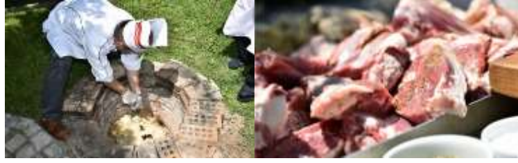
Resim 8. Aksaray Tulum Kebabına Ait Görseller

Çeşitli kaynaklardan elde edilen bilgilere göre; Tulum Kebabı, Hasandağı ve çevresindeki köylerde geçmişte çobanların yaptığı bir yemektir. Çobanlar eskiden bir kuyu kazıp içinde tulum kebabını yaparlarmış. Çobanlar sürünün arkasından gider ve akşam dönüşte yemek hazır olurmuş. Aksaray ilinde bir işletme yöresel yemek olan Tulum Kebabını araştırmış ve nasıl yapıldığını yörenin yaşlı kişilerinden öğrenmiştir. Tulum Kebabı, bir gün önceden 14-15 kiloluk erkek kuzu kesilmekte ve dinlendirilmektedir. Akşamdan iki kuyudaki ocaklar yakılmakta ve sabaha köz haline gelen ocağa odun ilavesi yapılmaktadır. Dinlenmiş olan kuzu parçalanır ve içerisine tuz, kekik, kimyon ve pul biberden oluşan baharatla harmanlandıktan sonra tulumun içerisine yerleştirilmekte ve tulumun ağzı dikilmektedir. Tulumun yanmaması için közü kapatacak kadar ocağa toprak atılmaktadır. Daha sonra demir tepsiye konulan tulum ocağın içerisine yerleştirilir. Üzeri saç ile örtülür ve kenarlardan hava almaması için toprak harç ile kapatılmaktadır. Sacın üzerine diğer ocakta bulunan köz dökülür ve üzeri büyük bir sac ile tekrar kapatılmaktadır. Yaklaşık 5 saat pişen kebabın yanına diğer kuyu da pişen bulgur pilavı servis edilmektedir (Aksaray Haber, 2015).