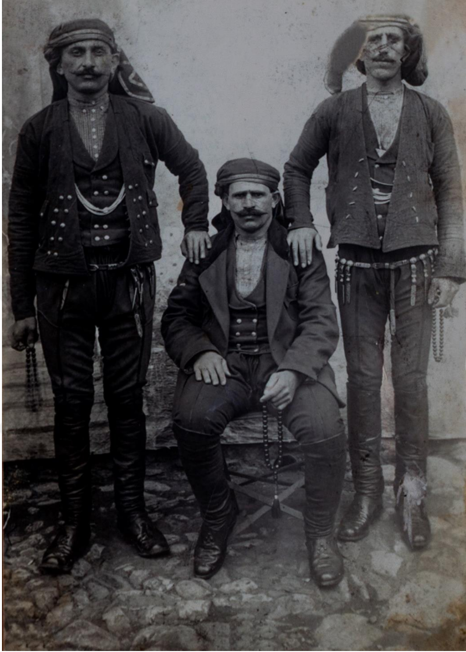
Kaynak: Murat Kasap, Osmanlı Arşiv Kayıtlarında 93 Harbi Batum Muhacirleri , Gürcistan Dostluk Derneği Yayınları:10, İstanbul, 2018, s. 312.