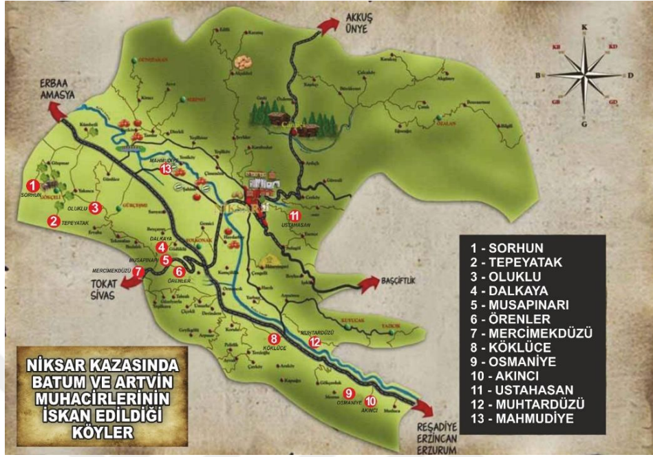
Harita 2: 93 Harbinden Sonra Batum ve Havalisinden Gelen Muhacirlerin Niksar Kazasında İskan Edildiği Köyler