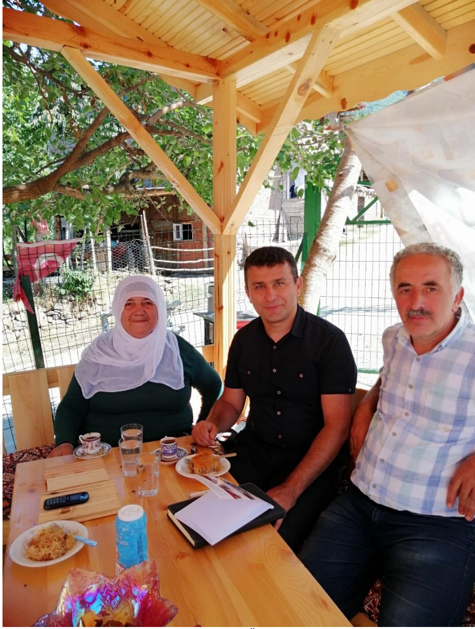
Kaynak: Orhan  ZEN Arşivi