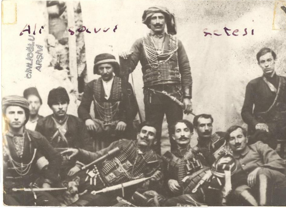
Kaynak: Hasan Akar ve Müjdat Özbay, Milli Mücadele Yıllarında Niksar , Niksar Belediyesi Yayınları, Ankara 2011, s. 157.