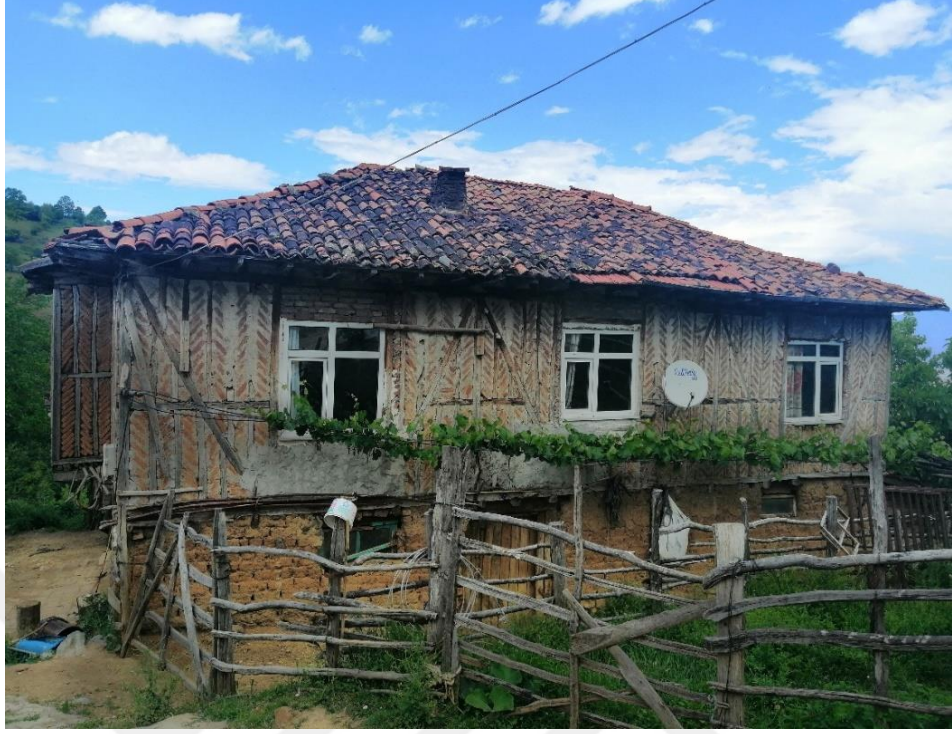
Fotoğraf 5: Oluklu (Pöhrekli) Köyünde İkamet Eden Muhacirlerin Evleri