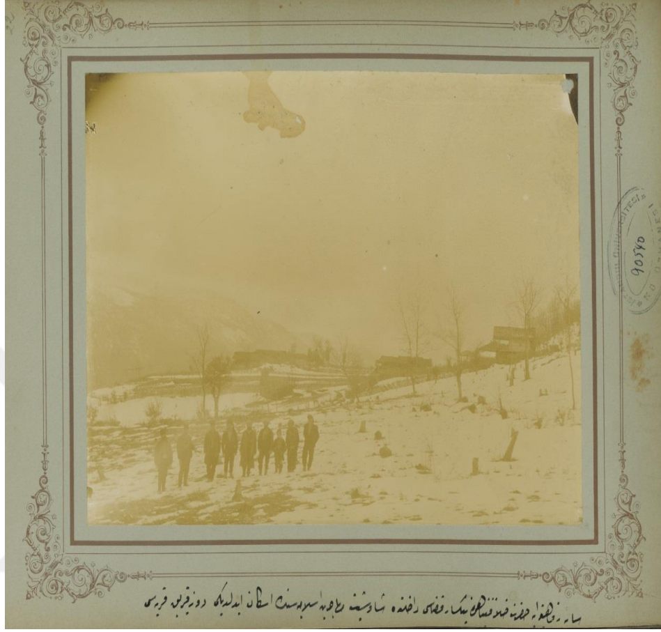
Fotoğraf 1: Sultan Abdülhamit'e Sunulan Niksar Kazası Dahilindeki Şavşat İslam Muhacirlerinin İskân Edildiği Düz kırık (Osmaniye) Köyünün Görüntüsü