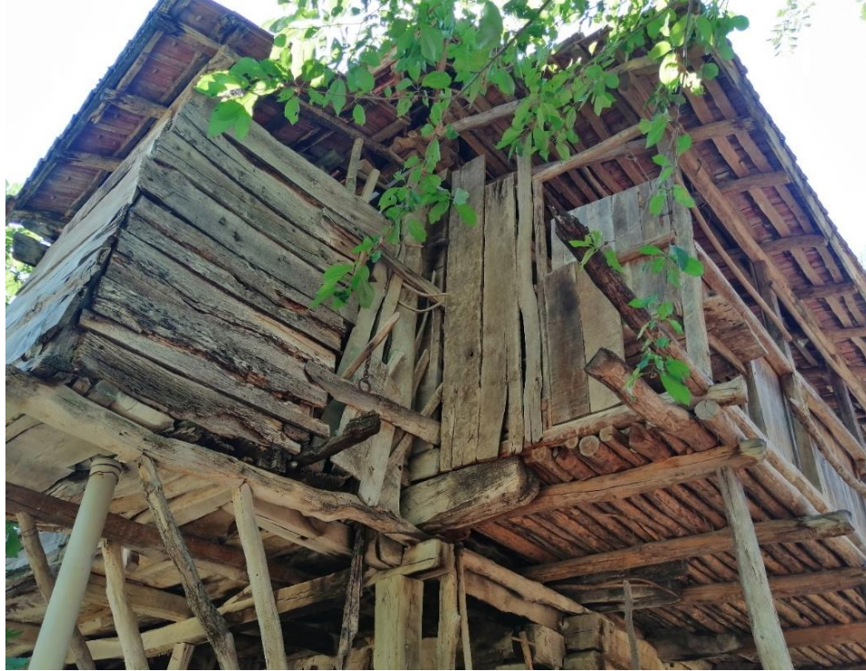
Fotoğraf 6: Osmaniye-Düzkırık Köyünde Muhacirler Tarafından Yapılmış Ev (Günümüzde atıl durumdadır.)