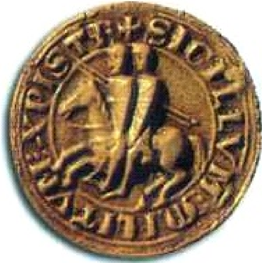
Resim 1. Tek ata binmiş iki şövalye.

tutumluluğunu ve mütevazılığını çağrıştıran önemli imgeler arasında yer almaktadır. 314 Üstadın görev simgeleri, meclis kurulu veya üstadın kendisi tarafından Hristiyanlığa bağlı şehirlere yollanan yoklama memurlarında bulunmuştur. Üstadın egemen olduğu topluluğu yönetmek ve tüzel kişilik görevlerini yerine getirmek üzere hizmetine verilmiş imkânlar vardır ve bunlara top, kese, kova ve hazinedarları verilmiştir. 315