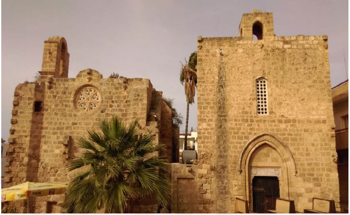
Resim 2. Soldaki Hospitalier, sağdaki ise Templier Şövalyelerine ait olan ve Gazimağusa’da yer alan İkiz Kiliseler.