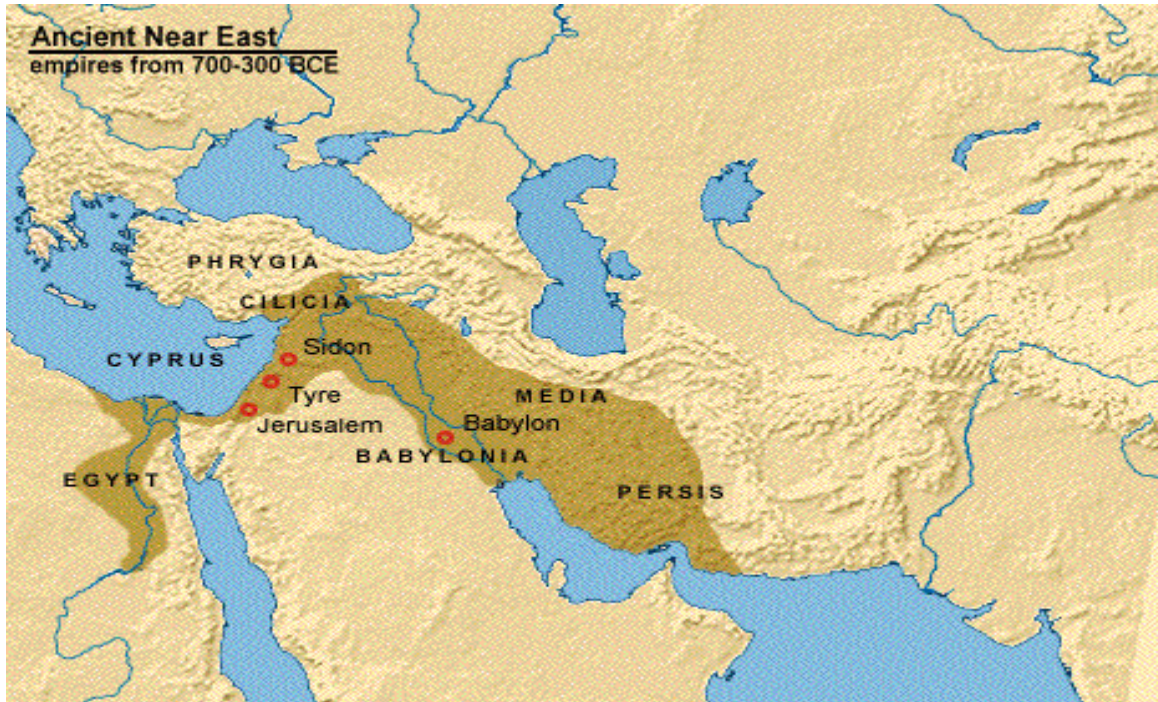
Ek 2: Asur Devleti (MÖ. 746-669).