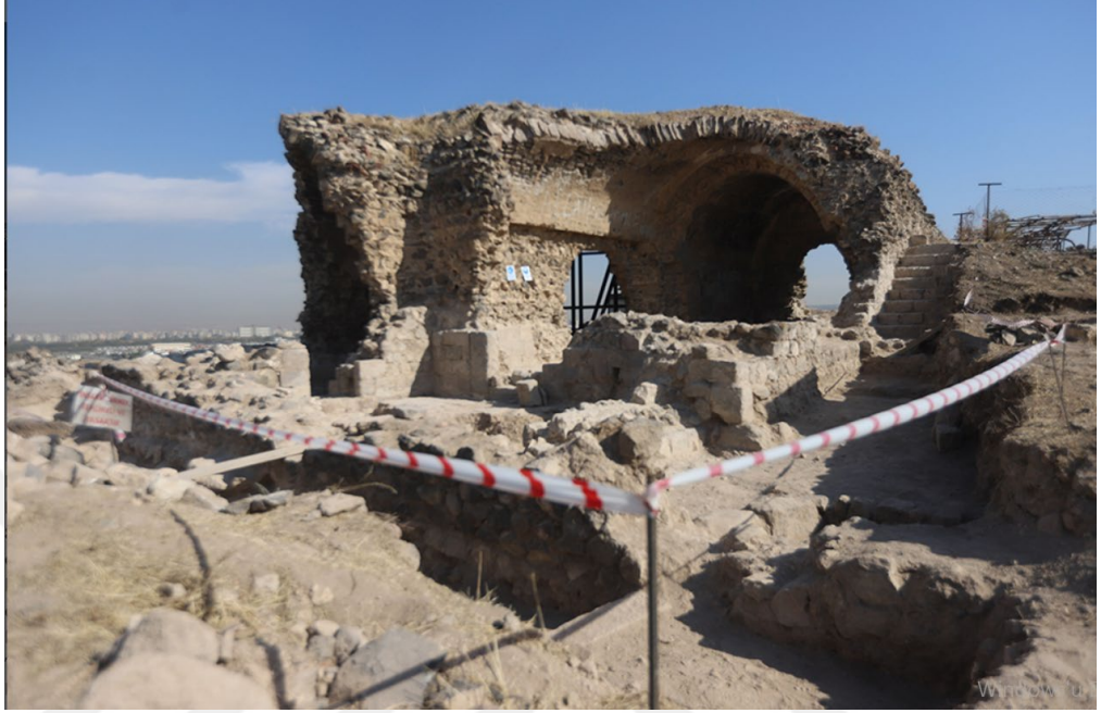
Şekil 1. 1Kentsel Arkeolojik Mekâna Örnek:1 Kızıl Köşk Kazısı

diğer belge ve görüşmeler yürürlükten kaldırılmış 1973 yılında 1710 Eski Eserler Kanunu yürürlüğe girmiştir (Ahunbay, 1999).