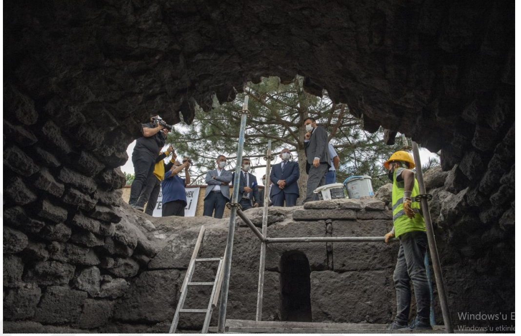
řekil 1. 2Kayseri'de Kentsel Arkeoloji rneđi: 2 Seyit Burhanettin Kazısı

gerektiđi nasıl korunacađı ve tarihe katacađı deđerle iliřkili aıklamaları ieren net bir tanım ve duruř sergilenmiřtir. Yapılacak dzenlemelerin hibir řekilde eski eserlere zarar vermemesi gerektiđi yeni inřa edilecek yapıların ise gemiř malzeme ile uyumlu olması gerektiđine dair sınırlar ekilmiřtir (Madran & zgnl, 2003).