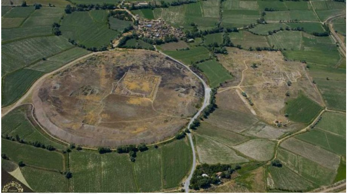
Şekil 1. 4Kayseri'de Kentsel Arkeolojik Mekan Örneği: Kültepe Arkeolojik Alanı

Med, Pers Egemenliği; Tabal dönemi Kilikya toprakları içerisine katılan Kayseri, Argaios yöresi de bu dönemde yine Kilikya'ya bağlı olarak adlandırılmıştır. Herodot'un verdiği bilgilere göre Lydia kralı Kroisos'un Pers egemenliğini yıkmaya düşüncesiyle Kapadokya'yı istila ettiğini söylemiştir. Perslerden öncede Med hâkimiyetinin olduğu düşünülmektedir. Pers satraplarının başkenti olarak adlandırılan Mazaka 6.yy'da Med kralı Kyaxares tarafından Kapadokya sınırları içerisinde bulunduğu düşünülerek hareket edilecektir. Med egemenliği hakkında yeterince bilgi sahibi değiliz. Pers kralı Kyros ile Lydia kralı Kroisos arasındaki savaş da Anadolu ile birlikte Kapadokya'nın da egemenliği Perslerin eline geçmiştir. Kapadokya ile İran yaşam biçiminin benzerliği Kapadokya'daki Pers egemenliğini hızlı bir şekilde güçlendirmiştir. Dareious I zamanında Kapadokya'nın başkentinin Mazaka olduğu düşüncesi en yakın ihtimaldir. Mazaka kültürel ve ekonomik açıdan önemli merkez olmasının yanı sıra önemli satrap ayaklanmalarının da merkezi olmuştur. M.Ö 360'da ikiye bölünmüş olan Kapadokya da asıl bölüm olan güneyde Mazaka yer almıştır. Pers etkisinin bu kadar yoğun olarak görülmesi tahakkümün bir sonucu değil benzerliğin ve ortak kültürün etkisiyle olmuştur (Baydur, 1970). Persler için coğrafi konumun ve doğal çevrenin önemi büyüktü ve bu sayede kolay bir biçimde adaptasyon sağlanmış ve ateş kültü için önemli bir yer olan Erciyes dağı kullanılmıştı (Şar, 2004).