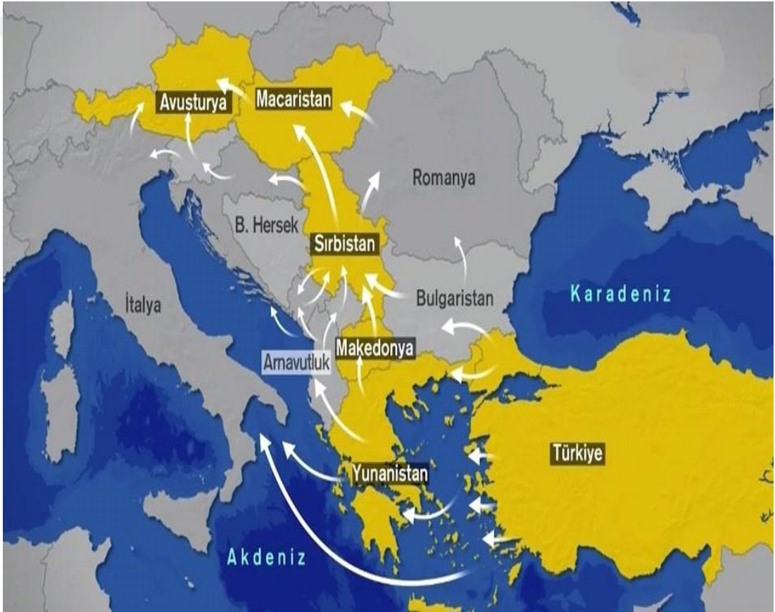
Şekil 4. Mültecilerin Türkiye Üzerinden Avrupa'ya Göç Rotası

düzeyine sahip gelişmiş ülkelere doğru kaymaktadır. Dünyanın gördüğü en büyük yıkımlardan olan II. Dünya Savaşı sonrasında hızlı bir toparlanmaya giden Avrupa, savaştan sonra 21. yy başına kadar olan süreçte çok sayıda göçmeni bünyesinde barındırmış ve günümüzde de barındırmaya devam etmektedir. Bu bağlamda iç savaş süreciyle birlikte milyonlarca Suriyeli öncelikle bölge ülkelerine sığınmaya çalışmış ve başta Türkiye olmak üzere Lübnan ve Ürdün gibi komşu ülkeler Suriyelilere kapılarını açarak ev sahipliği yapmıştır. Türkiye'ye ve diğer bölge ülkelerine sığınan Suriyelilerin çoğunluğu, zaman içerisinde daha iyi yaşam olanaklarına ulaşma amacıyla Avrupa'ya gitme eğiliminde olmuşlardır.