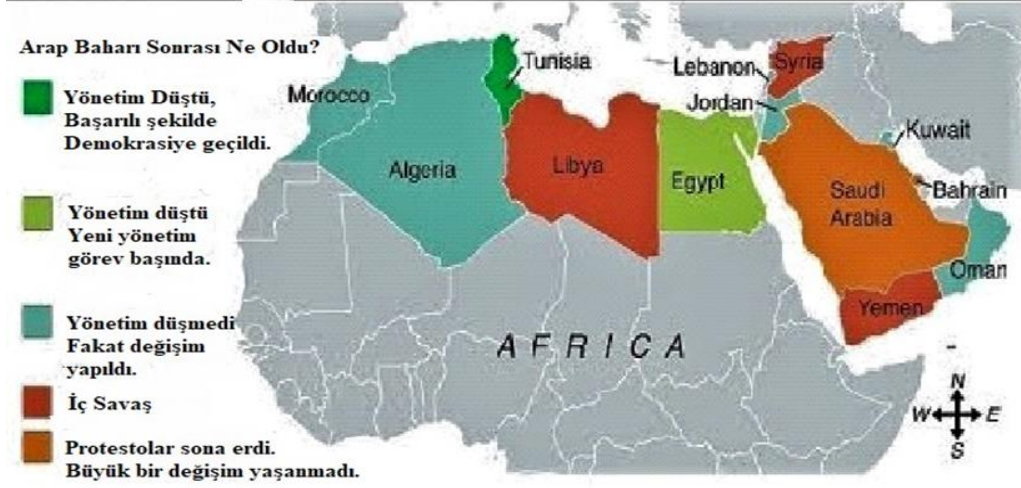
Şekil 1. Arap Baharının etkilediği ülkeler.