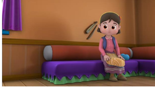
Resim 24. Duvarda asılı olan kemeçe