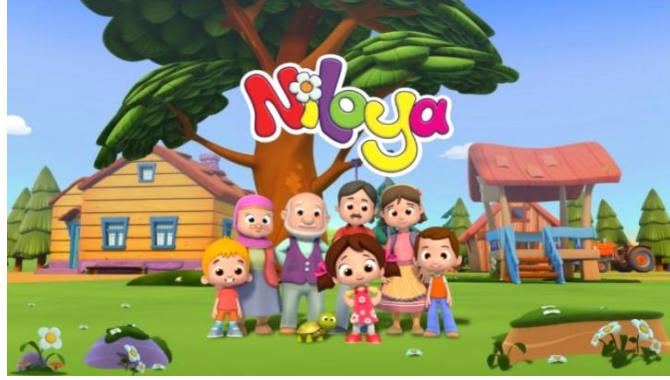
Resim 1. Niloya Çizgi Filmi

tarafsız, laik bir şekilde hazırlanmaktadır (Akgüner, 1998: 288). Bu anlayış toplumun tümünü yayın politikasında içermeyi amaçlarken, hedef kitlesi de toplumun tümüdür (Saraç, 2018: 46).