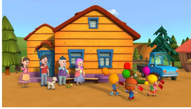
Resim 17. 23 Nisan kutlaması