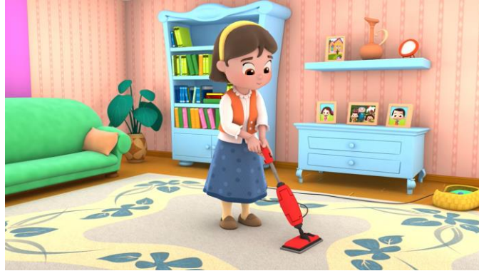
Resim 27. Anne ev temizliği yapıyor

Çizgi filmde kadın karakterlerin çoğunlukla ev içinde bulunduğu, ev ve mutfak işleri, çocuk bakımı vb. işlerle ilgilendiği; erkek karakterin ise çoğunlukla ev dışında bulunup araba sürme, odun kırma, tamir ve onarım gibi işlerle ilgilendiği görülmüştür. Bu durum toplumsal cinsiyete dayalı iş bölümünün ipuçlarını sunmaktadır. Seyredilen bölümlerde evin içindeki işlerde kadın aktifken, evin dışındaki işlerde daha çok erkek karakter ile birlikte kadın karakter de aktifleşebilmektedir. Örneğin hayvan bakımı ve bahçe işlerinde erkek karakterler kadar kadın karakterler de yer almaktadır. Erkek karakterler sık sık araba ve tekne kullanırken, kadın karakterler araç kullanırken hiç görülüyor.