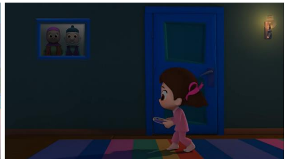
Resim 10. Koridordaki aile fotoğrafı