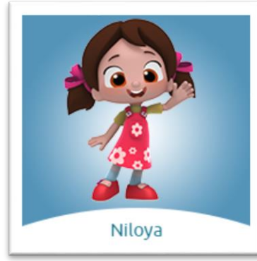
Resim 2. Niloya

Niloya 2009 yılında doğmuştur ( https://tr.wikipedia.org/wiki/Niloya ). İsmi, annesinin Nil, babasının Oya istemesi sonucunda dedesinin bir orta yol bulmak amacıyla o zaman herkes mutlu olsun, Niloya olsun demesi üzerine almıştır. Niloya hayali bir Karadeniz kasabasında, mutlu bir aile hayatı yaşamaktadır. Çizgi filmin akışı içerisinde Niloya abisi Murat, arkadaşı Mete ve dostu Tospik ile her gün oyunlar oynayarak yeni şeyler öğrenmektedir ve keşfetmektedir. Merak ettiği, yalnız yapamadığı her şeyi büyüklerine danışmaktadır, onların yardımını istemektedir. İp atlamayı, sekseği, saklambacı ve bebeklerle oynamayı çok sevmektedir ( https://www.niloya.com/Karakterler/Niloya ).