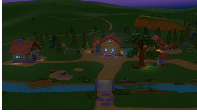
Resim 23. Köy

Çizgi filmde Karadeniz bölgesine ait geleneksel kıyafetlere de yer verilmektedir. Gündelik kıyafetlerde özellikle babaanne ve dedede bu geleneksel kıyafetler oldukça kendini belli etmektedir. Diğer karakterlerde de bazı bölümlerde geleneksel kıyafetlere yer verilmiştir. Örneğin “ Horon ” adlı bölümde Niloya horon kıyafeti ile gösterilmiştir.