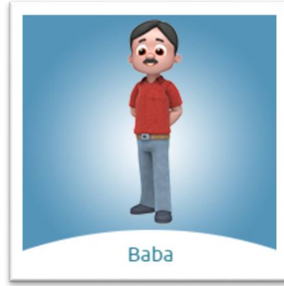
Resim 5. Niloya'nın Babası

Baba 1974 doğumludur ( https://tr.wikipedia.org/wiki/Niloya ). Eşinden iki yaş büyüktür ve biraz uzundur. Bu durum kadının erkekten küçük ve kısa olması hakkındaki cinsiyetçi anlayışı desteklemektedir. Kıyafet türü olarak gömlek ve pantolon tercih edilmektedir. Niloya'daki bıyıklı baba görüntüsü geleneksel baba figürü ile örtüşmektedir. Baba çiftçilik ve balıkçılık ile uğraşmaktadır. Bahçe işleri, tamir işleri, balık tutma ve araba kullanmak gibi ev dışındaki işleri babanın üstlendiği görülmektedir. Çocuklarını çok seven ve ilgili bir baba olarak sunulmaktadır ( https://www.niloya.com/Karakterler/Baba ).