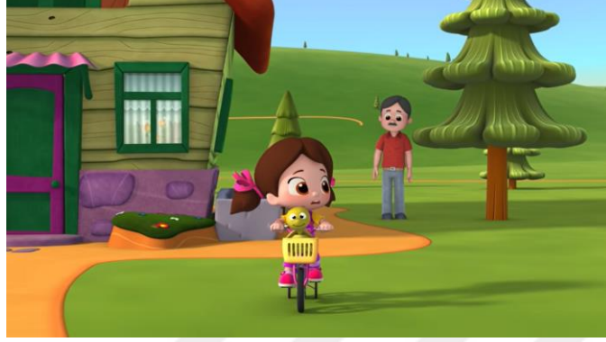
Resim 14. Niloya bisiklet sürüyor

Bu içerikte baba çocuğun ihtiyaç duyduğu anda yanında olacağını hissettirerek güven duygusunu pekiştirmektedir.