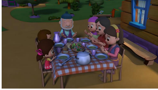
Resim 19. İftar sofrası

Dini bir bayram olan Ramazan Bayramı da çizgi filmin bir bölümüne konu edilmiştir. “ Ramazan Bayramı ” isimli bu bölümde geleneksel ritüellere yer verilmiştir. Bölüm evin oturma alanında tüm aile fertleri bir arada otururken başlar. Önce Murat sonra Niloya sırasıyla dedenin, babaannenin, babanın, annenin elini öper. Dede elini öptükten sonra Niloya ve Murat’a küçük bir hediye paketi ile karşılık verir. Babaanne de elini öpen torunlarına birer mendil ile karşılık verir. Niloya annesinin elini öperken (2:02) “bayramın kutlu olsun annem” der annesi de “el öpenlerin çok olsun güzel kızım” diye yanıt verir. Niloya da Tospik’e dönerek “küçükler büyüklerin elini öper, haydi Tospik sen de benim elimi öp” der ve ailesini güldürür. Ardından Niloya arkadaşı Mete ile köydeki evleri kapı kapı gezerek şeker toplamaya çıkar.