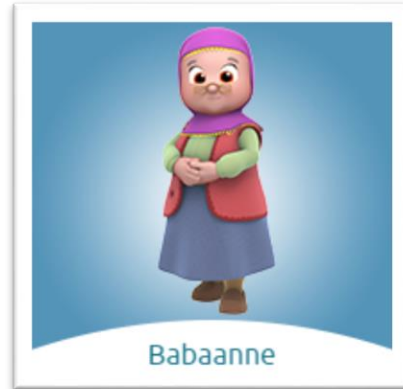
Resim 6. Niloya'nın Babanesi

Baba 1974 doğumludur ( https://tr.wikipedia.org/wiki/Niloya ). Eşinden iki yaş büyüktür ve biraz uzundur. Bu durum kadının erkekten küçük ve kısa olması hakkındaki cinsiyetçi anlayışı desteklemektedir. Kıyafet türü olarak gömlek ve pantolon tercih edilmektedir. Niloya'daki bıyıklı baba görüntüsü geleneksel baba figürü ile örtüşmektedir. Baba çiftçilik ve balıkçılık ile uğraşmaktadır. Bahçe işleri, tamir işleri, balık tutma ve araba kullanmak gibi ev dışındaki işleri babanın üstlendiği görülmektedir. Çocuklarını çok seven ve ilgili bir baba olarak sunulmaktadır ( https://www.niloya.com/Karakterler/Baba ).