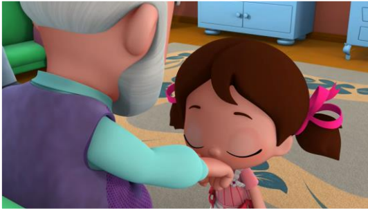
Resim 20. Bayramlaşma

Dini bir bayram olan Ramazan Bayramı da çizgi filmin bir bölümüne konu edilmiştir. “ Ramazan Bayramı ” isimli bu bölümde geleneksel ritüellere yer verilmiştir. Bölüm evin oturma alanında tüm aile fertleri bir arada otururken başlar. Önce Murat sonra Niloya sırasıyla dedenin, babaannenin, babanın, annenin elini öper. Dede elini öptükten sonra Niloya ve Murat’a küçük bir hediye paketi ile karşılık verir. Babaanne de elini öpen torunlarına birer mendil ile karşılık verir. Niloya annesinin elini öperken (2:02) “bayramın kutlu olsun annem” der annesi de “el öpenlerin çok olsun güzel kızım” diye yanıt verir. Niloya da Tospik’e dönerek “küçükler büyüklerin elini öper, haydi Tospik sen de benim elimi öp” der ve ailesini güldürür. Ardından Niloya arkadaşı Mete ile köydeki evleri kapı kapı gezerek şeker toplamaya çıkar.