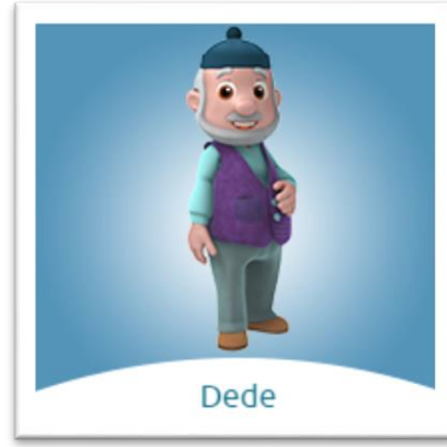
Resim 7. Niloya'nın Dedesi

Dede ise babaanneden iki yaş büyük, 1950 doğumludur ( https://tr.wikipedia.org/wiki/Niloya ). Dede de babaanne gibi orta boylu, hafif kiloludur. Beyaz sakalları ve bıyıkları fiziksel olarak Türkiye'de geleneksel dede imajı ile uyumludur. Bilgi ve deneyimleri ile aile fertlerine, çevresine yol gösterir.