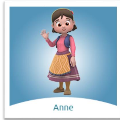
Resim 4. Niloya'nın Annesi

Niloya'nın abisi olan Murat 2007 yılında doğmuştur, yani Niloya'dan 2 yaş büyüktür ( https://tr.wikipedia.org/wiki/Niloya ). Boyu Niloya'dan biraz uzundur. İki kardeş birbirini çok sevmektedir. Murat okula gitmektedir, eve gelince ödevlerini yapmaktadır, sonra kardeşi ve arkadaşlarıyla birlikte keyifli oyunlar oynamaktadır. Top, misket ve arabalarla oynamayı, fındık toplamayı çok sevmektedir. Yaşadıkları yer bir kasaba olduğu için çoğunlukla dışarıda vakit geçirmektedirler ( https://www.niloya.com/Karakterler/Murat ).