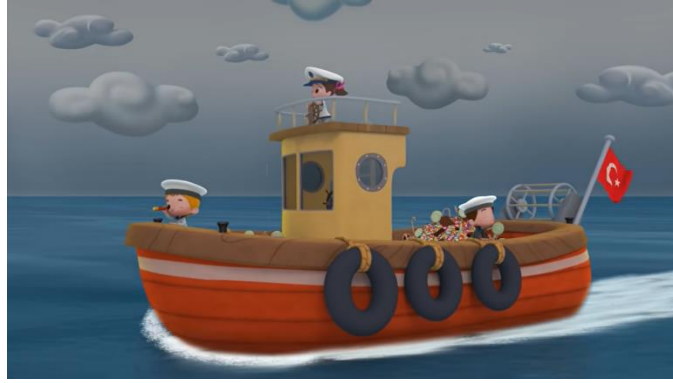
Resim 26. Karadeniz Gemisi

Palamutla upraları Saklar altında Karadeniz Akın akın balıkları Palamutla upraları Saklar altında Karadeniz Karadeniz Karadeniz Her Őeyini ok severiz”