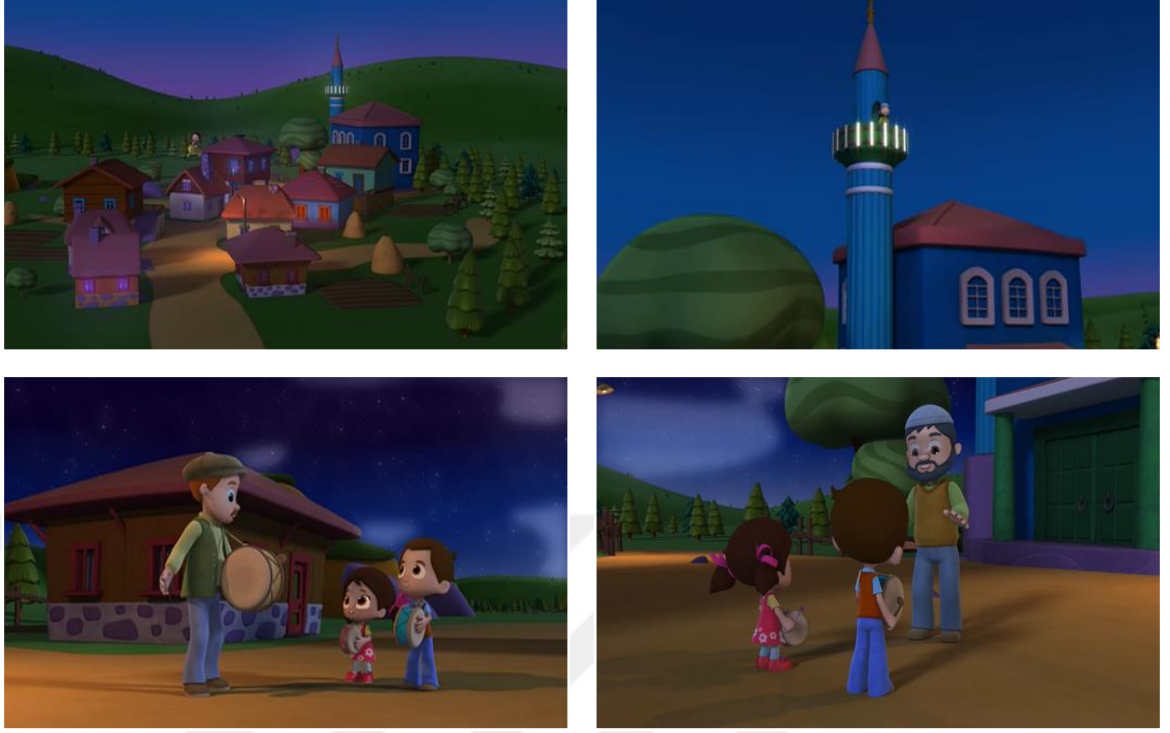
Resim 18. Sahur

Çizgi filmde bir Türk-İslam geleneği olan Ramazan ayında iftar vaktinin geldiğini haber veren top patlatmasına da yer verilmiştir. “İftar” adlı bölümde Niloya annesine iftarın ne zaman olacağını sorar ve annesi top patlayınca diye yanıt verir. Bu cevap Niloya’yı üzer ve endişelendirir. Bu yüzden köydeki bütün topları korumak için toplar. İftar vakti yaklaşır ve ailece sofrada topun patlamasını beklerler. Vakit geldiğinde top patlar ve Niloya koşarak topladığı topları kontrol eder. Annesi iftar topunun ne olduğunu anlatınca rahatlar. Ailece neşe içinde iftar yaparlar. Oruç açmadan önce ailedeki her ferdin ellerini açarak dua etmesi de dikkat çeken bir diğer ritüeldir.