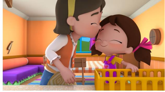
Resim 16. Teşekkür ederim tatlı karınca

“ Zambak ” adlı bölümde Niloya babaannesinin zambak toplamak istediğini fakat bacakları ağrıdığı için ormana gidip toplayamadığını duyar. Niloya babaannesinin bu isteğinin yerine gelmesi için ona yardım etmek ister. Abisi ve Mete ile ormana giderek zambak toplar. Yine aynı bölümde dede ahırda başka işleri olduğundan yavru keçi ile ilgilenmeleri için torunlarından yardım ister. “ Denizden Ne Çıkacak ” adlı bölümde baba Niloya ve Murat balık tutmak üzere tekne ile denize açılır. Bölümün sonunda baba çocuklara sarılır ve ”benim akıllı güçlü çocuklarım, bugün gerçekten bana çok yardımcı oldunuz, size çok teşekkür ederim” der.