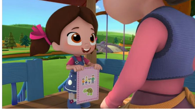
Resim 8. Niloya'nın dokuduğu halı

Niloya ve annesi arasında geçen bu konuşma çizgi filmde aile birliğine verilen önemi vurgulamaktadır. Çizgi filmde yemeklerin her zaman birlikte yenmesi de aile birliği mesajını destekler niteliktedir. Yemekler zaman zaman Niloya, abi, baba, anneden oluşan çekirdek aile olarak, zaman zaman babaanne ve dedenin de içinde olduğu geniş aile olarak yenmektedir. Sohbet ve gülüşmeler eşliğinde yemeklerin yendiği sofranın görüntüsünün çizgi filmde sunulan aile birliği iletisini güçlendirdiği şeklinde yorumlanmaktadır.