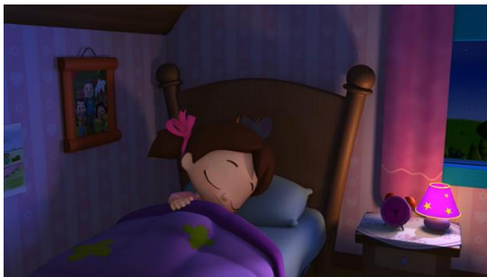
Resim 9. Niloya'nın odasındaki aile fotoğrafı

Çizgi filmin çeşitli sahnelerinde görüldüğü üzere evin bazı yerlerinde aile fotoğrafları yer almaktadır. Örneğin “ Domates ” adlı bölümde (3:02) Niloya ve çekirdek ailesinin yaşadığı evin koridorunda dede ve babaannenin fotoğrafının asılı olduğu görülmektedir. “ Anne Kaplan ” adlı bölümde (1:02) Niloya'nın yatağının yanında dedesi ve abisi ile olan bir fotoğraf yer almaktadır. Benzer bir fotoğrafın evin oturma alanında dolabın üstünde de yer aldığı “ Sakarlığım Üstümde ” (3:07) adlı bölümde görülmektedir. Evin çeşitli yerlerinde aile fotoğraflarının yer alması aile birliğine verilen önem ile ilişkilendirilmiştir.