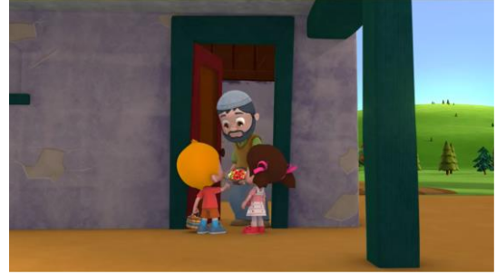
Resim 21. Şeker toplama

“ Sarı Yapraklar ” adlı bölümde örtük bir şekilde sunulmuş olsa bir başka dini sembole daha rastlanmıştır. Bu bölümde Niloya’nın yazın bitip sonbaharın gelmesine üzülmeye çalışır. Niloya evlerindeki kitapları karıştırarak mevsimler hakkında bilgi edinmeye çalışır. Sonra dedesinin yanına giderek ondan yardım ister. Bu sırada dedenin okuduğu “Mukaddes Emanetler” isimli kitap ve kitabın üzerindeki cami resmi