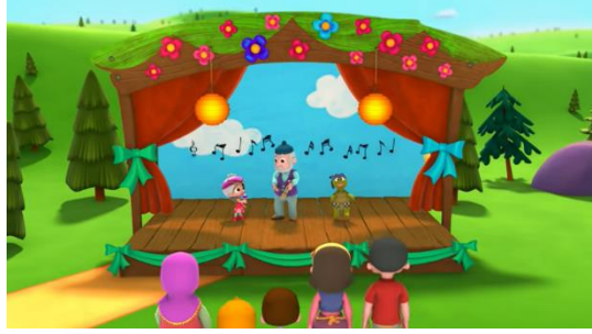
Resim 25. Kemeçe dinletisi

“ Karadeniz’de Bir Gemi ” adlı bölümde Niloya, Murat ve Mete iskelede Niloya’nın gemide olan babasını ve dedesini bekler. Beklerken Niloya abisinden daha önce anlattığı Karadeniz Gemisi adındaki hikâyeyi tekrar anlatmasını ister. Murat da kardeşini kıramaz ve şu cümlelerle hikâyeyi anlatmaya başlar: