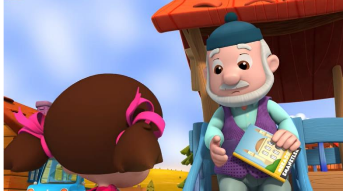
Resim 22. Dedenin okuduğu kitap

dikkat çekmektedir. Bu örnekte olduğu gibi çizgi filmlerde hedef kitleye yani çocuklara olayların içinde örtük değerlerin aktarılması mümkündür.