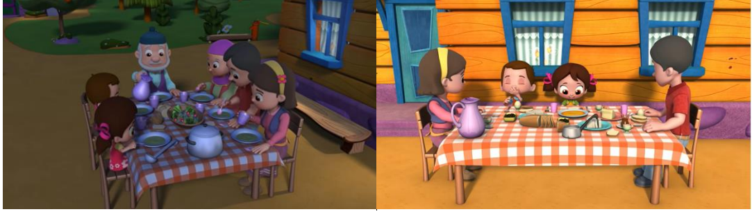
Resim 13. Yemek sofrası

Çizgi filmde aile içinde izin isteme ve büyüklerin sözünü dinleme davranışları da birer saygı göstergesi olarak kabul edilmiştir. Niloya'nın eylemlerini annesinden ya da yanındaki büyüklerinden izin alarak gerçekleştirmesi dikkat çekmiştir. Örneğin “ Kemençe ” adlı bölümde (1:01) duvarda asılı olan kemençeyi almak için annesinden izin ister. “ Çilek Reçeli ” adlı bölümde (2:46) Niloya arkadaşları ile tepelere papatyaları görmeye gitmek için izin ister. “ Yıldızlar Yere Mi Düştü ” isimli bölümde (1:17) Niloya akşam saatlerinde bahçede yıldızları seyrederken annesi “Niloya kızım hadi artık eve gel” diye seslenir. Niloya da “hemen geliyorum anne” diyerek yanıt verir ve hemen eve girer. “ Bülbül Şarkısı ” adlı bölümde iyileştirmek üzere yaralı bir kuşu eve alırlar. Baba kuş iyileşince onu kendi doğasına bırakmak gerektiğini söyler. Niloya bunu hiç istemediği halde babasının sözünü dinler ve kuşu doğasına bırakırlar. “ Nehrin Ötesi ” adlı bölümde Niloya nehrin diğer tarafını merak eder ve oraya gitmek üzere koşar. Annesi “Niloya kızım, öteye gitme yanımda dur.” der. Niloya hemen durur ve “Peki anneciğim.” der. Bu ilişki örnekleri aile içerisinde büyüklere saygının bir ifadesi olarak değerlendirilebilir.