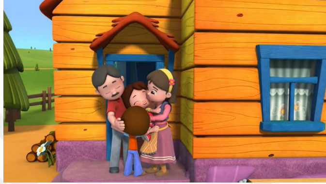
Resim 11. Aile sevgisi

Çizgi filmde sevgi ve saygı değerine sıklıkla vurgu yapılmaktadır. Niloya ailesine, arkadaşlarına, hayvanlara, doğaya karşı sevgisini gösteren bir çocuktur. Aile içinde bu sevgi bağı oldukça önemlidir. Çizgi filmde sevgi değeri değerlendirmesi için sevgi sözcükleri kullanma, sarılma, öpme gibi davranışlar esas alınmıştır.