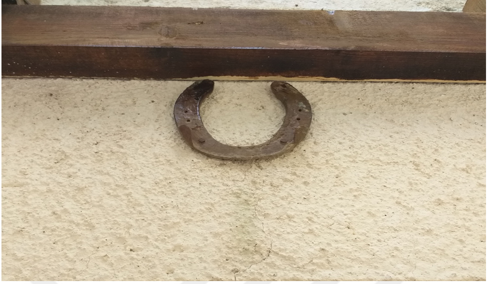
Resim 3.9. At nalı örneđi

Bazı evlerde kör keven dikeni, at nalı, nazar boncuđu ve inek boynuzu veya kafatasını birlikte asarlar ( K5, K25, K30 ).