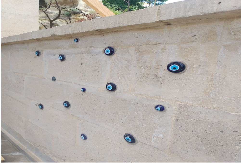
Resim 3.12. Nazar boncuęu örneęi