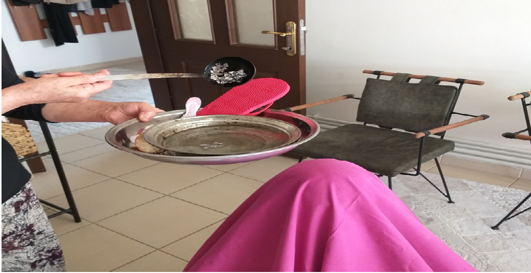
Resim 3.20. Kurşun dökme 1. aşama örneği