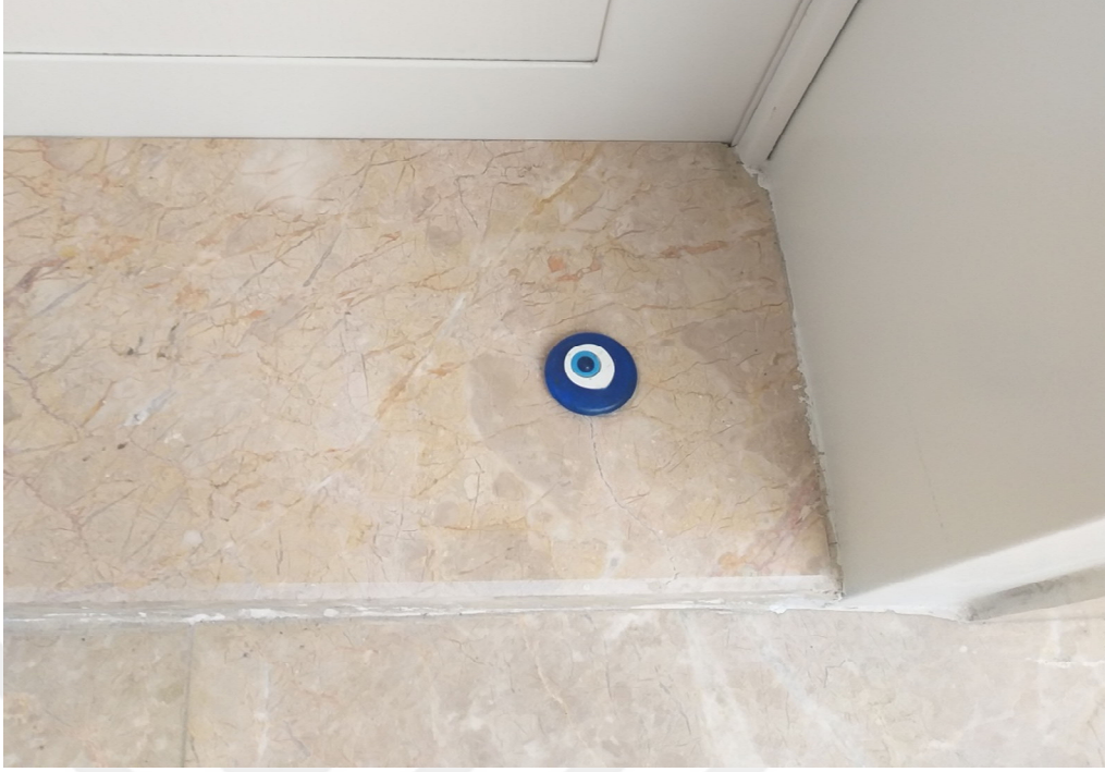
Resim 3.13. Nazar boncuğu örneği