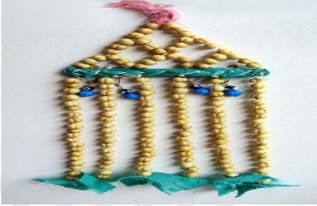
Resim 3.16. Nazar boncuğu örneği

Halk arasında yaygın inanca göre üzerlik otunun yetiştiği topraklar şehit kanıyla sulanmış topraklardır. Bu inanışta ki gerçeklik payıda şöyle açıklanmaktadır; üzerlik otu fosfatlı toprakları sevdiği için fosfatlı toprakların bol olduğu mezarlıklarda yetişir. Üzerlik bitkisi halk arasında “nazar otu” olarak bilinir.