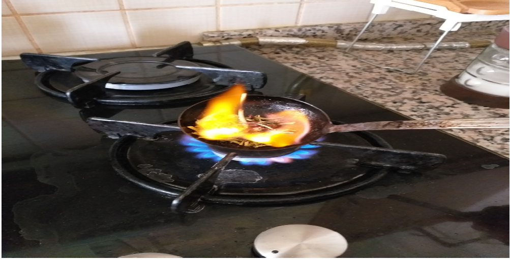
Resim 3.25. Kurşun döktükten sonra üzerlik yakma örneği