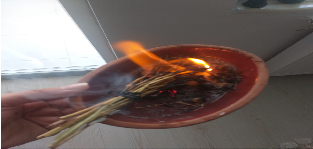
Resim 3.27. Tütsüleme örneği

Tütsü için genellikle üzerliğin kullanılması, dumanının bol olması ve tohumlarının yanarken çatlayıp ses çıkarmasından dolayıdır. Çıkan bu seslerle nazarı değen kişinin nazarının bozulacağına inanılmaktadır. Tütsüleme sırasında “hazara, huzara, göz edenlerin gözleri bozara” tekerlemesi söylenir. Bugün de özellikle kırsal çevrelerde çeşitli bitkilerin tütsüleme yoluyla nazarın tedavisinde ya da evin içinde ki kötü ruhların kovulmasında kullanıldığı görülmektedir.