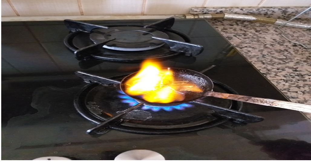
Resim 3.19. Kurşun eritme yöntemi