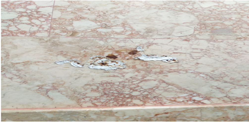
Resim 3.24. Kurşun dökme son aşama örneği