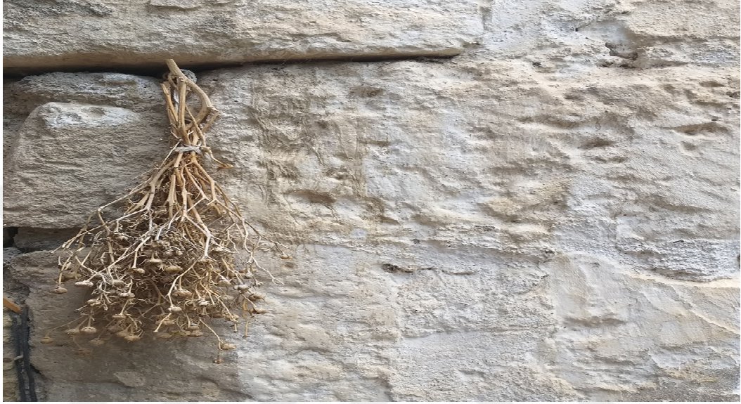
Resim 3.17. Üzerlik örneği

“Üzerlik otunun koruyuculuğuna ve kötü gözleri uzaklaştırdığına olan inançtan dolayı evin dışına veya içine asılır Bazen süs eşyası olarakta vazoların içine konur. Evin dışına asılan üzerlik otunun ailenin koruyuculuğunu üstlendiğine inanılır.