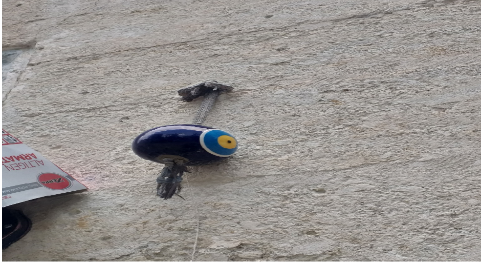
Resim 3.14. Nazar boncuğu örneği

Göz şeklindeki nazar boncuğunun tasarımı, gözle temas eden nazarın göz ile etkisiz hale getirileceği fikrine dayanmaktadır (Bayar, 2020: 118). Nazar boncuğunun etkili olduğunu kanıtlayan kaynak kişinin bir anlatı örneği şöyledir: