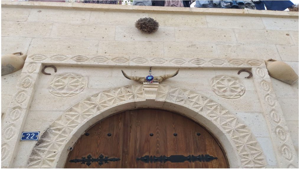
Resim 3.10. İnek boynuzu örneđi

Bazı evlerde kör keven dikeni, at nalı, nazar boncuđu ve inek boynuzu veya kafatasını birlikte asarlar ( K5, K25, K30 ).