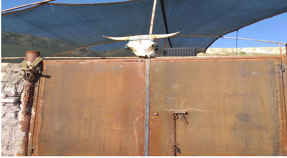
Resim 3.5. Akköy de bir ahırın kapısında inek kafatası

Sarımsağın altı, çörek otu, iğde ağacı parçası bir beze bağlanıp nazar değmesini engellemek için büyükbaş ve küçükbaş hayvanlara takılır (K4, K5, K7, K8, K17, K22, K29, K30) .