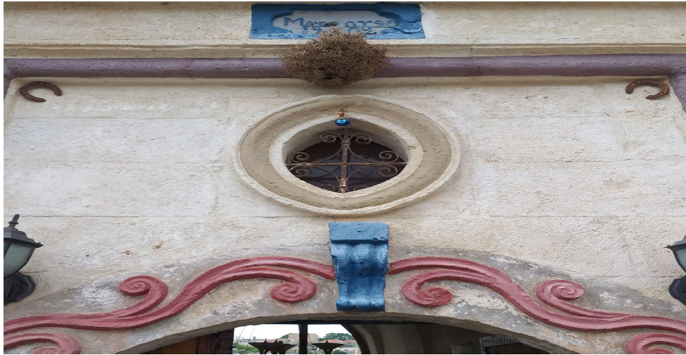
Resim 3.6. Kör keven bitkisi

Evin girişine nazarı engellemek için kör keven dikenini asılır. Böylelikle dikkati bitkinin üstüne çekip kem gözleri evdekilerden korumak amaçlanıyor (K1, K2, K3, K4, K5, K7, K8, K9, K11, K12, K13, K14, KK27, K28, K29, K30, K32, K33, K34, K35, K36, K37, K39, K43, K45, K46, K47, K48, K49).