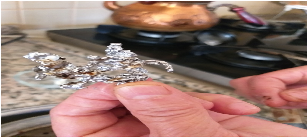
Resim 3.21. Kurşun döktükten sonra ortaya çıkan şekil örneği