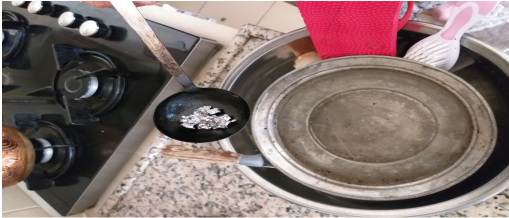
Resim 3.18. Kurşun dökmek için malzemeler

Son olarak nazar degen kişi bir miktar para verir. Böylelikle bütün nazarın, kötülüğün gideceğine inanılır.