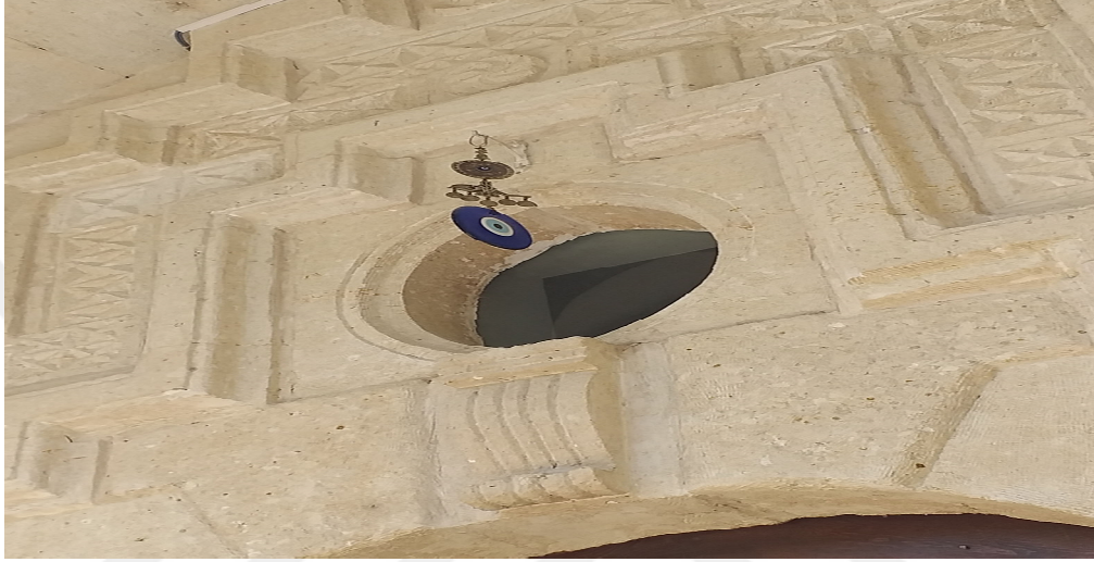
Resim 3.15. Nazar boncuğu örneği

“Oğlumun düğününü yaptık dört dörtlük evinin eşyalarını dizdik. Benim eşimin ailesi çok kıskançtır, nasıl böyle ev dizdiler, nasıl aldılar herzeyi diye her yerde konuşuyorlarmış. Düğün olduktan sonra gelin kızı görmeye geldiler. Evde kocaman nazarlık asmıştım. Nasıl hasetle, kıskançlıkla baktularsa onlar gidince nazarlık düşüp ortadan ikiye ayrıldı” (K11).