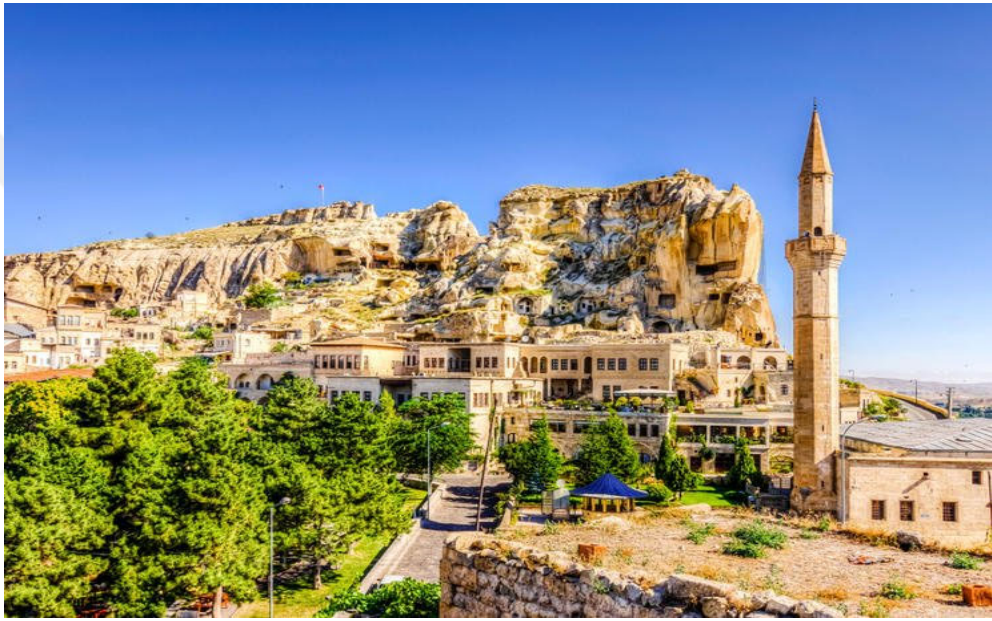
Resim 3.1. Ürgüp'ün genel görünümü

38°24'-38°45° kuzey enlemleri ve 34°47'-35°08° doğu boylamları arasında olan Ürgüp, İç Anadolu Bölgesi'nde Orta Kızılırmak Havzası'nın en güney ucunda yer alır. İlçe 574 km 2 yüz ölçümündedir. Doğusunda Kayseri merkez İncesu ilçesi, batısında Nevşehir İli merkez ilçesi, kuzeyinde Nevşehir Avanos ilçesi ve güneybatısında Nevşehir İli Derinkuyu ilçesi, güneyinde Kayseri ili Yeşilhisar ilçesi ile sınırları vardır. Engelibeli bir arazide kurulan Ürgüp Nevşehir'in 20 km doğusundadır. Ürgüp'ün jeolojik yapısı, Kapadokya bölgesinin jeolojik yapısı iç ve volkanik akışın değerlendirilmesiyle farklı biçimlerde oyulan kayalar doğa harikasına dönüşmüştür. Doğal olayların yanı sıra Bizans Dönemi'nde Putperestlik karşıtı hareketin yaygınlaşması Hristiyanlığın başladığı dönemde bölgeye sığınan Hristiyanlar yumuşak kayaları oyup, şekil vererek içlerinde yaşamışlardır. Ürgüp ve