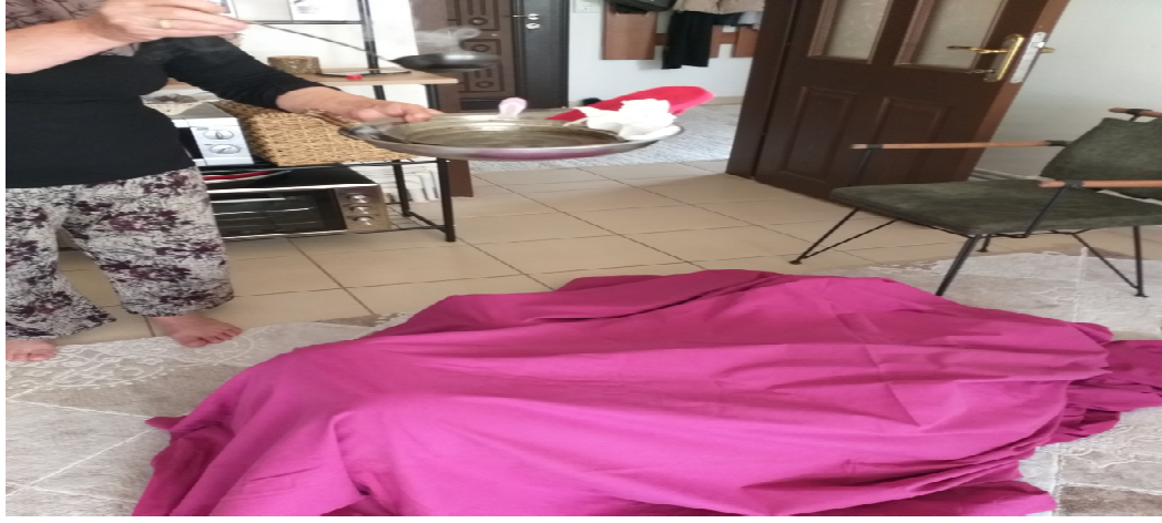
Resim 3.22. Kurşun dökme 2. aşama örneği