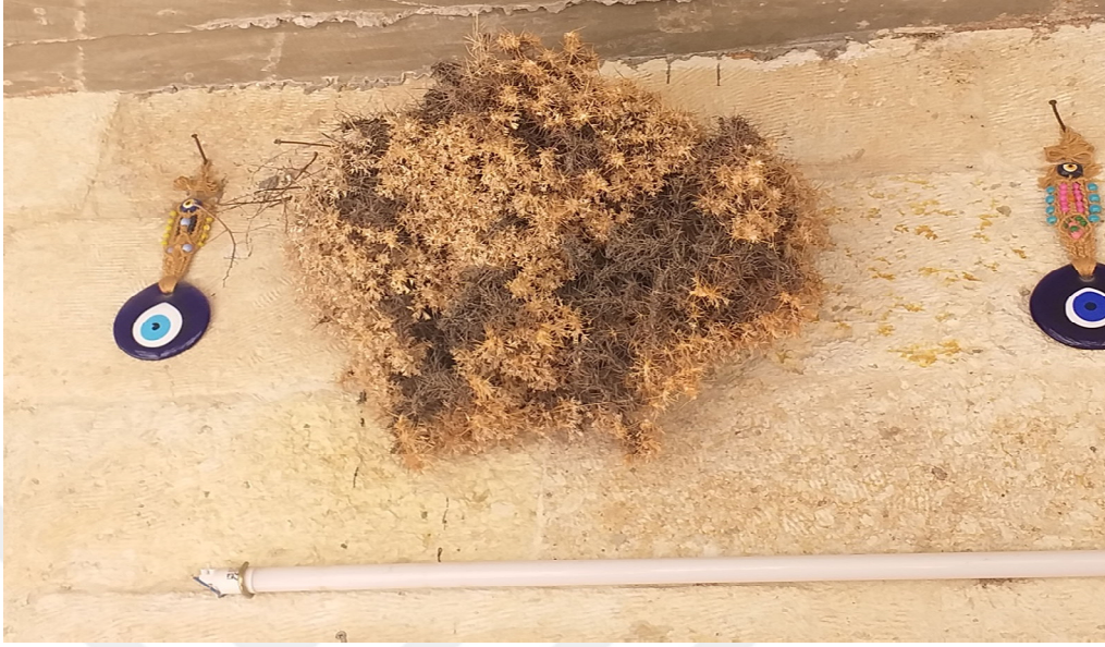
Resim 3.11. Nazar boncuęu örneęi

K22, K24, K25, K26, K27, K28, K29, K30, K32, K33, K34, K35, K36, K37, K43, K45, K46, K47, K48, K49).