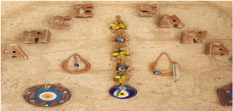
Resim 3.8. Nazar boncuğu örneği

“At nallarını zaman zaman mavi boncuklarla süsleyerek evlerimizin girişine asarız ve nazardan korunduğumuza inanırız” ( K2, K3, K4, K8, K9, K11, K12, K13, K17, K19, K20, K21, K22 ).