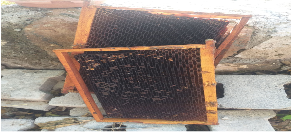
Resim 3.26. Mum dökme örneği

Bu mum özel olarak arının peteğinden yapılır ve arı mumu olarak geçer. Öncelikle bir kalburun ya da eleğin içine bakır kap içinde su konulur, suyun içine maden para ve iğne atılır. Daha sonra kalburun içine soğan, sarımsak yerleştirilir. Nazar değen kişi yere oturtulur ve üzerine çarşaf örtülür. Ocakta tavada mum eritilir ve tek sefer olarak kişinin başına kalbur tutulur ve eriyen mum suya dökülür. Eğer mum göz göz olursa ,iğnede suyun üstüne çıkarsa nazar var demektir. Şifa için sudan içilir. Kabin içinde ki parada mum döken kişiye verilir (K4) .