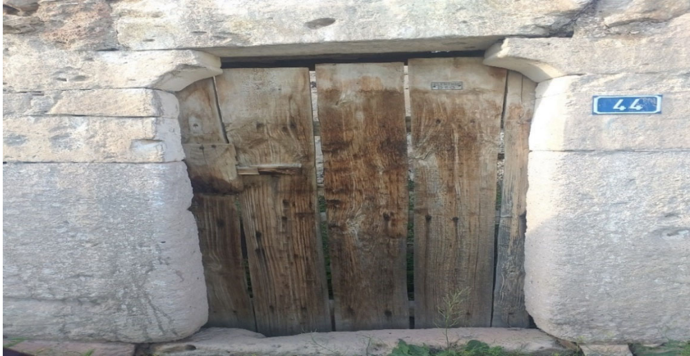
Resim 3.28. K4 örneği

“Nazar eden kişi biliniyorsa o nazar eden kişinin kapısından (sürgülü ağaç kapı) bir parça ağaç alınıp yakılırdı. Böylece nazarın yok olduğuna inanılırdı” (K4).