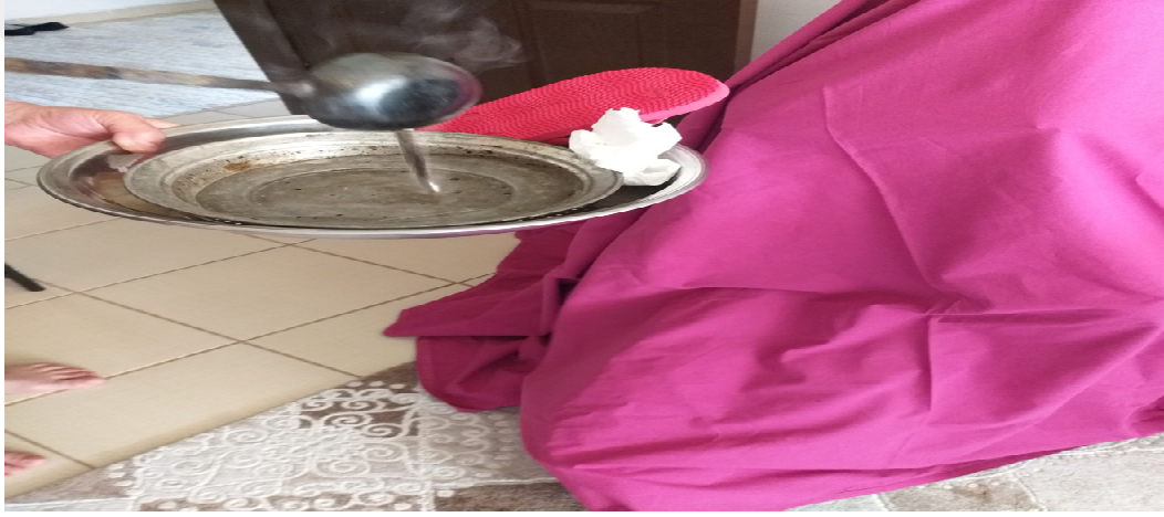
Resim 3.23. Kurşun dökme 3. aşama örneği