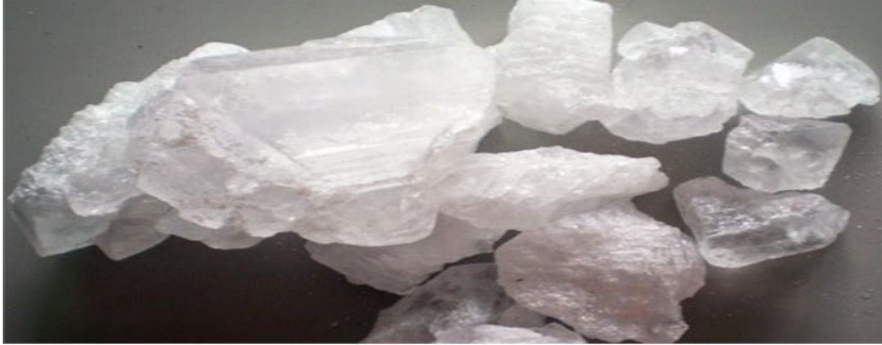
Resim 3.4. Nazar için kullanılan “Şep” örneği

Çocukların, yetişkinlerin omzuna kaya tuzu şeklinde “şep(şap)” adında bir şey takılır. Eğer o şep parçalanırsa o kişinin üzerinde nazar olduğuna inanılır (K2, K3, K5, K7, K8, K9, K11, K12, K13, K14, K15, K19, K20, K21, K24, K25, K26, K27, K28, K29,42, K49).