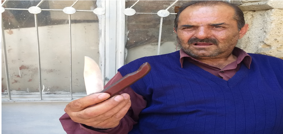
Resim 3.2. Kaynak kişinin bahsettiği bıçak