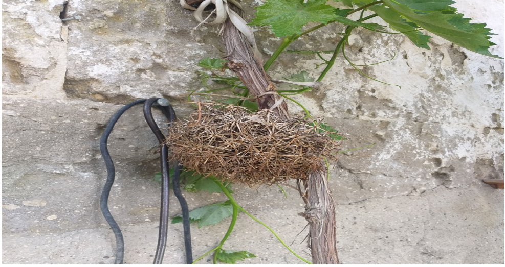
Resim 3.7. Kör keven dikenini bahçeyi koruması için

Nazar değmesin diye evlere, iş yerlerine “at nalı” asılır ( K1, K2, K3, K4, K5, K7, K8, K9, K11, K12, K13, K14, K15, K16, K17, K19, K24, K25, K26, K27, K28, K29, K30, K32, K33, K34, K36, K37, K44, K46, K47, K48, K49 ).