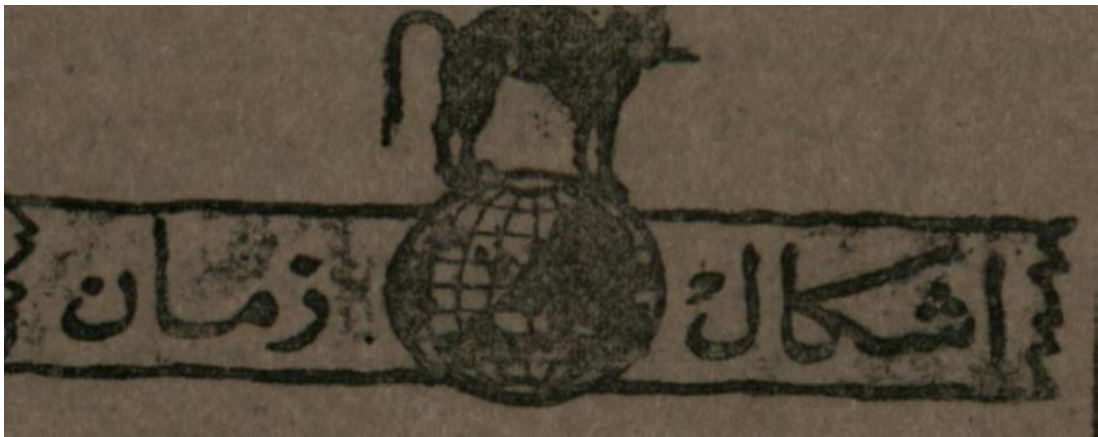
Şekil 1.2: Yeni Gün gazetesinin 24 Ekim 1919, 217. Sayısının 2.sayfası

Yunus Nadi'nin çıkarmış olduğu Yeni Gün gazetesinde ana başlıklar kalın punto ile yazılır. Gazetede görsellik ön planda tutularak yazılar desteklenir.