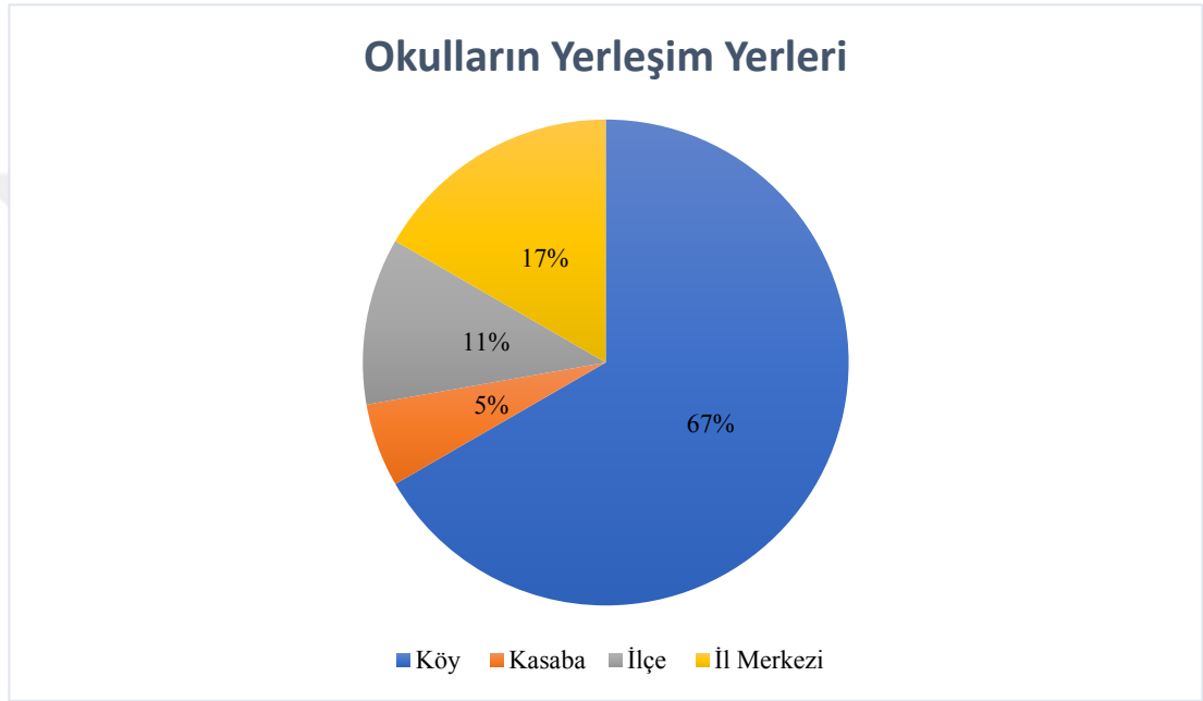
Şekil 4: Çalışılan Yerlerim Yerleri

Yine demografik açıdan okulun yerleşim yerine dair bulgulara bakıldığında aşağıdaki şekli görürüz.