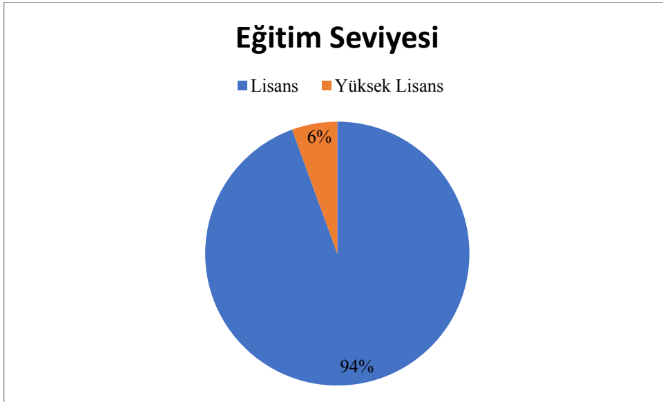
Şekil 3: Katılımcıların Eğitim Seviyeleri

Katılımcılara dair eğitim seviyeleri ise aşağıdaki gibidir: