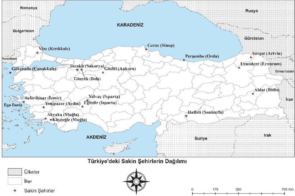
Şekil 3: Türkiye'deki Sakin Şehirlerin Dağılımı.