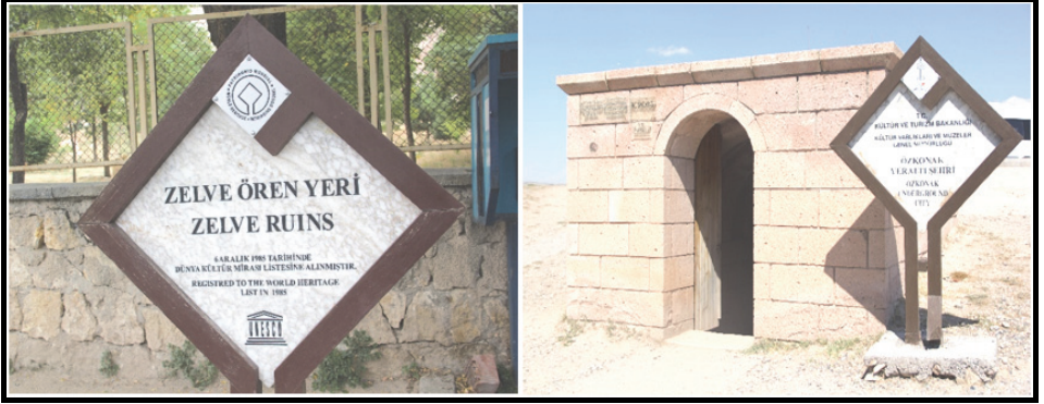
Foto 3: Zelve ren Yeri ve zkonak Yeraltı řehri giriřlerinden bir grnm.

Kapadokya Blgesi, Trkiye'nin en nemli ve en dikkat eken turizm merkezlerinin bařında gelmektedir. Blge kltrel, tarihi ve inan turizm deęerleri aısından nemli bir destinasyondur. Eęsiz vadileri ve peribacaları ile Kapadokya, dnya turizminin gzde merkezlerinden biri haline gelmiřtir. Kızılırmak tarafından ikiye blnen Avanos ise, Kapadokya Blgesi'nin en nemli merkezlerinden birisidir. Nevřehir merkezine yakın olan Avanos, birok tarihi destinasyonları, mimari alanları, doęal ekicilikleri, el sanatları ve somut olmayan kltrel miras deęerleri aısından bir cazibe alanıdır. Bu aıdan řehrin en dikkat eken turizm kaynakları řu řekilde sıralanabilir: Zelve Aık Hava Mzesi, Pařabaęı Vadisi, zkonak Yeraltı řehri, avuřın Kilisesi, Zelve Kiliseleri, Belha Manastırđ, Vaftizci Yahya Kilisesi, Topaklı Hyę, e Tmls, Saruhan Kervansarayđ, Alaaddin Cami, Ulu Cami ve Geleneksel Avanos Evleri (Gngr, 2015; Gngr, 2016) (Foto 3).