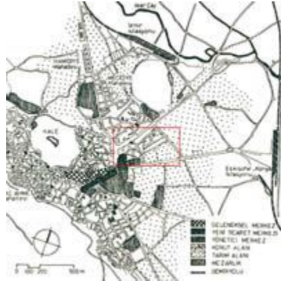
Kroki-1 XIX. Yüzyıl başlarında Afyonkarahisar şehrine ait kroki