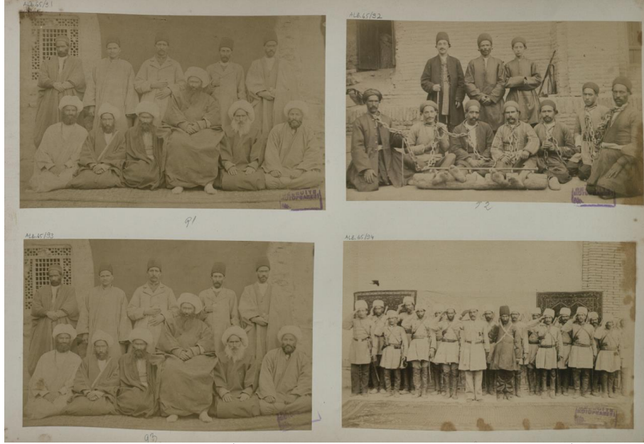
Resim-1 Osmanlı İmparatorluğu'nda hapisanede mahkumlar, (Erişim Tarihi: 08.12.2014)