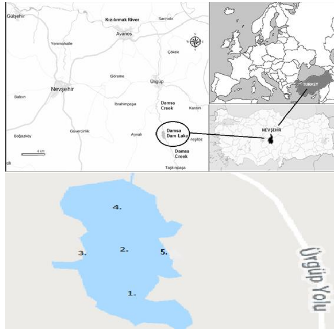
Şekil 1. Damsa Baraj Gölü ve çalışma istasyonları

Çalışma alanı olarak belirlenen Damsa Baraj Gölü, İç Anadolu Bölgesi'nin Nevşehir İli'nde karasal iklime sahip ve ortalama su yüksekliği 32,50 metredir. Damsa Barajı Gölü Nevşehir İli'nde Ürgüp İlçesi'nde Damsa Çayı üzerinde sulama amacı ile 1965-1971 yılları arasında inşa edilmiştir. Toprak gövde dolgu tipi olan barajın gövde hacmi 862000 m 3 , normal su kotunda göl hacmi 7,12 hm 3 , normal su kotunda göl alanı 0,82 km 2 'dir. Baraj 1390 hektarlık bir alana sulama hizmeti vermekle birlikte yılda 1 hm 3 içme-kullanma suyu sağlamaktadır. Aynı zamanda baraj, görünümü ve ağaçlandırılmış çevresiyle piknik alanı olarak da kullanılmaktadır. İl merkezine uzaklığı 30 km, ilçe merkezine ise (Ürgüp) 9 km uzaklığındadır (Bağdatlı vd., 2015).