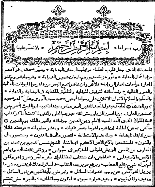
Ek 4: Hicrî 1290/Miladî 1873 tarihinde Kazan'da basılan "Hediyetü's-şu'lûk" un ilk sayfası (Toplam 268 sayfa).