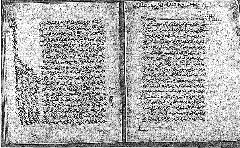
Ek 1: Kütahya Vahidpaşa İl Halk Kütüphanesi'nde bulunan "Hediyetü's-şu'lûk" yazmasının ilk iki sayfası. Arşiv numarası: 43 Va 107(185 varak).