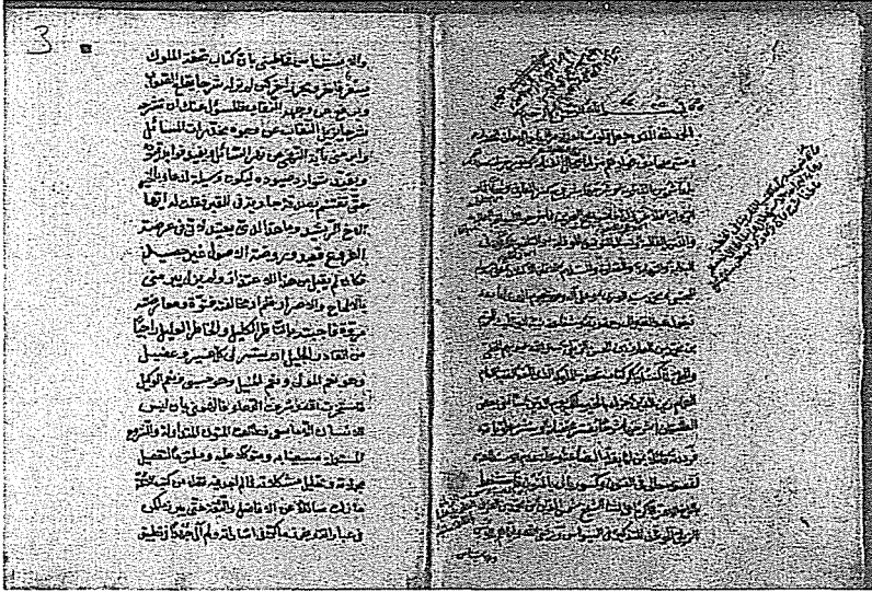
Ek 3: Ankara Milli Kütüphanesi’de bulunan diğer bir “Hediyyetü’ş-şu’lûk” yazmasının ilk iki sayfası. Arşiv Numarası: 55 Hk 628/1 (234 vaka).